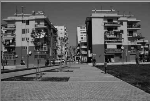
Riqualificazione di un quartiere comunista