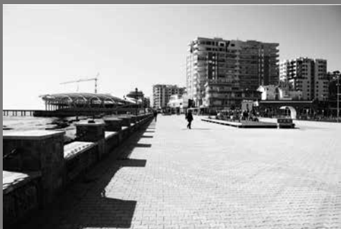
Lungo mare "Vollga"

La metamorfosi della città di Durazzo, avvenuta in pochi anni, rappresenta una delle conseguenze della transizione. Il periodo storico che ha coinvolto l'Albania è molto simile ad altri stati dell'ex blocco sovietico come l'Ungheria, la Polonia, la Repubblica Ceca e la Slovacchia.