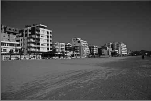
La città turistica, espansione negli ultimi vent'anni