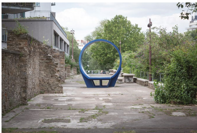
fig. 4 – Quartiere de la Création, Nantes.