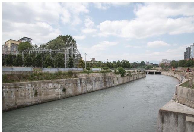
fig. 5 – Spina 3, la Dora (Fotografia di Lorenzo Attardo, in Untitled. Spazi ibridi della città contemporanea , «Atti e Rassegna Tecnica», LXXIII/2, 2019, p. 157).