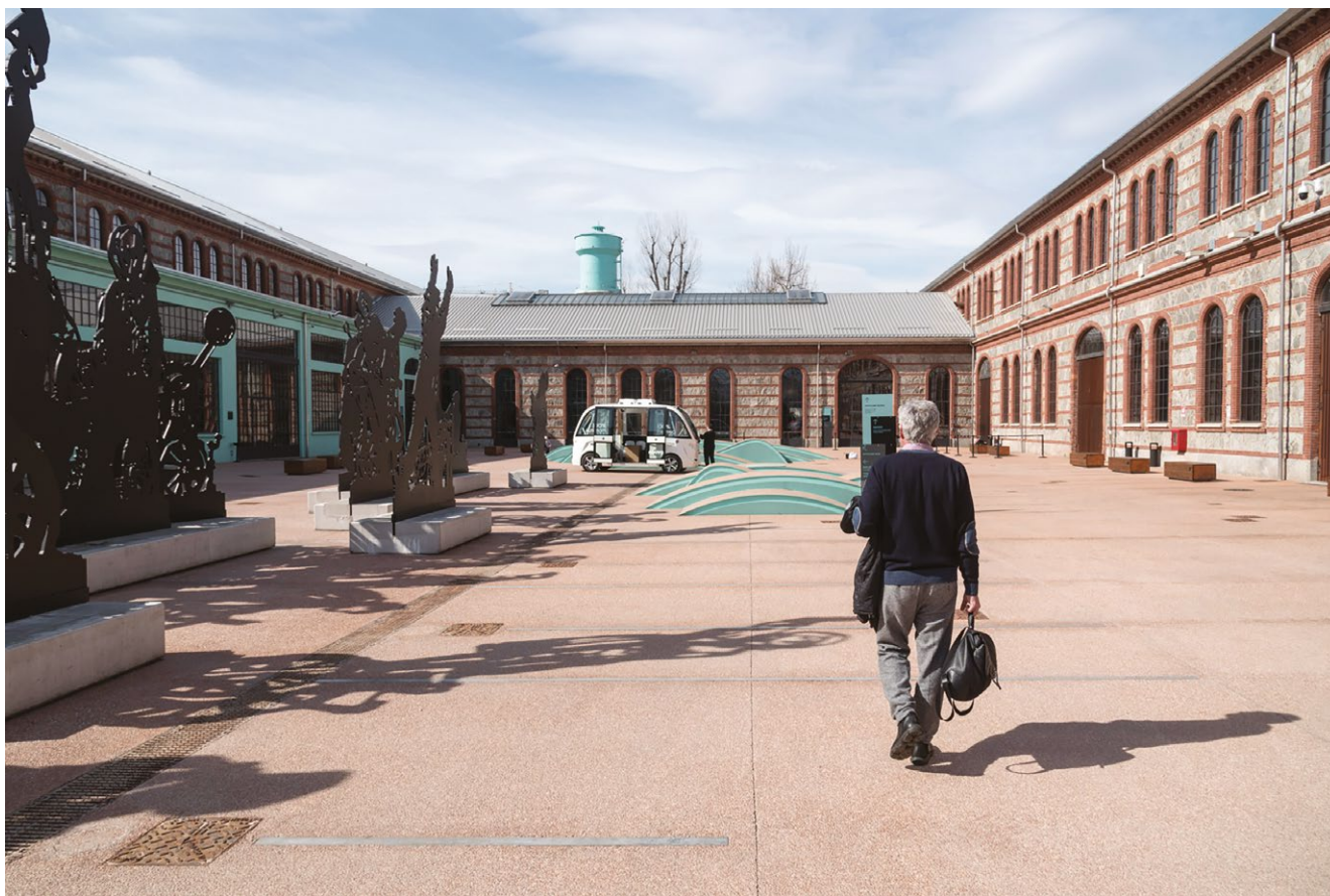
fig. 8 – OGR, corso Castelfidardo.

contesto, in cui vengono evidenziati i legami tra determinati eventi, ma affermandosi come un concetto che supera questa idea 13 .