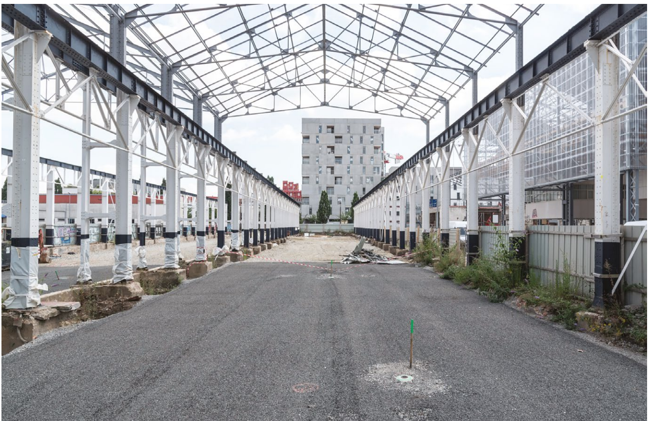
fig. 3 – Quartiere de la Création, Nantes.

Ecco, quindi, che questi profondi cambiamenti portano alla presenza, scomoda in quanto non omologata, ma al contempo affascinante campo di ricerca e punto di ripartenza, dei cosiddetti paesaggi fragili. Sono paesaggi costantemente visibili e invisibili agli occhi di tutti: sono i borghi dimenticati sulle alture collinari e montane, sono i paesi dell'entroterra ancora legati a ritmi rurali e tradizionali, sono percorrenze in disuso, come le antiche vie del sale o alcuni tratti montani, sono le numerose aree archeologiche scavate e mai valorizzate, sono le sempre più ingombranti periferie, sono i luoghi di risulta, dove a volte la natura ha preso il sopravvento, sono gli spazi produttivi dimenticati, sono quei luoghi che hanno lasciato la fortuna commerciale e turistica ad altri, magari accomunati dai medesimi valori, ma solo più accessibili e/o appetibili (figg. 5-6). Sono spazi ai margini, imperfetti, che per questo non vogliamo vedere, ma sono anche questi il frutto del nostro passato e delle azioni più o meno coscienti che sono state operate sul territorio nel corso degli anni e questi luoghi, esattamente come quelli che definiamo “bellezze naturali” o di cui vantiamo dichiarazioni di notevole interesse, a definire la nostra relazione con il paesaggio, a raccontare la nostra storia, a ricordarci di operare con maggiore responsabilità. «Siamo, ci sentiamo fuori luogo. Siamo spaesati, in senso