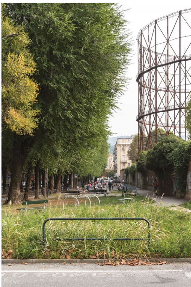
fig. 6 – Gasometro, corso Luigi Farini (Fotografia di Lorenzo Attardo, in Untitled. Spazi ibridi della città contemporanea , «Atti e Rassegna Tecnica», LXXIII/2, 2019, p. 153).

sia metaforico che letterale» 8 davanti a questi paesaggi dimenticati, «non ci riconosciamo negli orizzonti (fisici e politici) che ci circondano» 9 proprio perché frutto di scelte imprudenti che appartengono ad altre generazioni, delle quali oggi dobbiamo «saldare il conto» per evitare che, correndo dietro alle chimere dei nuovi modelli abitativi, queste aree marginali prendano il sopravvento, diventando sempre più numerose e travolte dall'incuria. La