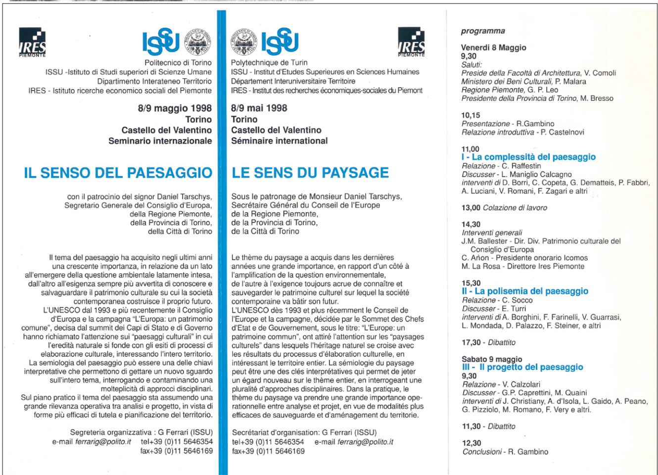
figg. 1-2 – Locandina e programma del seminario internazionale Il senso del paesaggio , tenutosi nelle giornate dell'8-9 maggio 1998, presso il Castello del Valentino, Torino.

Se il paesaggio accoglie il sedime della memoria storica di una civiltà, allora è contemporaneamente il modo attraverso il quale la popolazione si percepisce, si rappresenta e si relaziona con gli altri, pertanto si può affermare che «è un modo di vedere che possiede la propria storia» 3 . Parlare di identità del paesaggio, dunque, trascende l'uso che si fa di un territorio, ma si concentra prevalentemente sul concetto di paesaggio quale manifestazione tangibile di eventi succeduti nel tempo, che lasciano una sedimentazione stratificata. Questo sistema di trasformazioni che hanno composto, scomposto e ricomposto il palinsesto territoriale, possiedono intrinsecamente quegli elementi identitari e simbolici indispensabili nel tentativo di riqualificare un paesaggio. Tuttavia, laddove ci sono stati fenomeni demografici, produttivi, economici non regimentati, non è sempre così facile identificare questi elementi: in luoghi in cui il degrado – non solo quello ambientale – è imperante, in cui si assiste a un progressivo declino sociale e politico, in cui il patrimonio viene gestito in modo da aggirare la normativa, in cui vengono assecondati abusi e deturpamenti e tutto viene etichettato e considerato solo in relazione all'attribuzione di un valore monetario, dove risiede l'identità e la dignità di quei paesaggi?