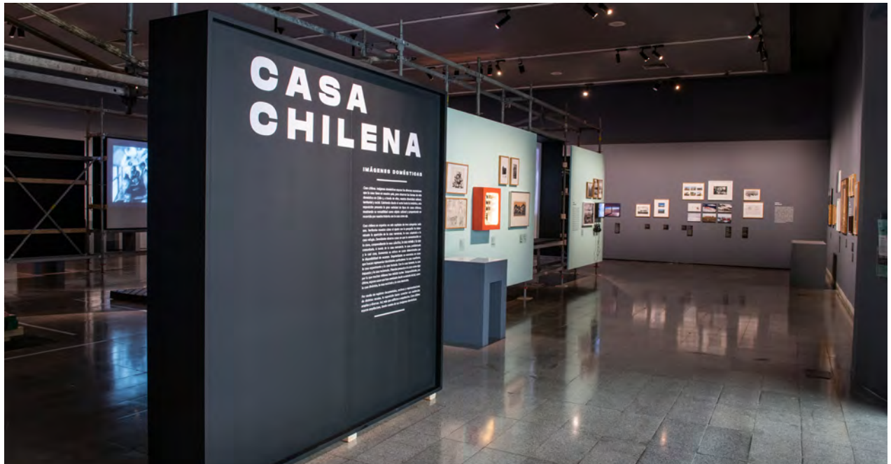
Figura 1 Vista del acceso a la exhibición "Casa Chilena. Imágenes Domésticas" (2020).