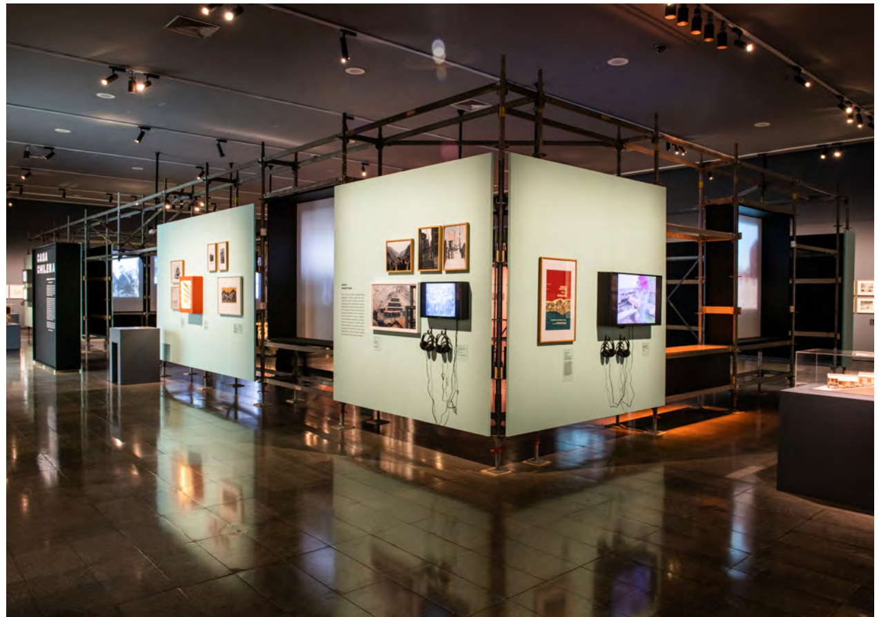
Figura 2 Vista interior de la exposición "Casa Chilena. Imágenes Domésticas" (2020). Nota: © Cyril Pérez, 2020. Cortesía Centro Cultural La Moneda.