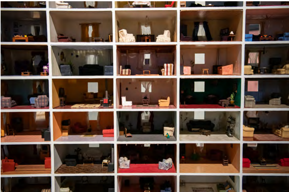
Figura 8 Vista de la sección "Temporalidades" de la exposición "Casa Chilena: Imágenes Domésticas" (2020). En primer plano, fragmentos de las fundaciones del edificio Alto Río.