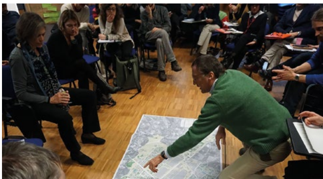
Figura 3. Foto di una delle tavole rotonde.

Sicuramente durante la fase di visualizzazione il designer sfrutta le sue competenze per sistematizzare e interpretare i dati raccolti e renderli facilmente leggibili a tutti gli attori coinvolti con diversi background. Attraverso questa fase sicuramente si produce un linguaggio comune a tutti, un campo di gioco condiviso in cui ogni attore riesce a contribuire con le sue specifiche competenze e a definire un quadro sempre più complesso e onnicomprensivo. Significativo è anche il dato che il Politecnico di Torino in questo progetto fosse coinvolto con diversi dipartimenti (DAD, DIST e DISAT), proprio grazie alle diverse competenze tecniche di cui è ricco l'Ateneo, e che il coordinamento dell'intero raggruppamento fosse in capo al design. Il design ha tenuto insieme in modo olistico e partecipativo non solo le competenze che provenivano dall'esterno (dagli stakeholder sopra