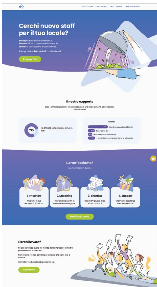
Figura 2. RestWorld, piattaforma web per la valorizzazione del capitale umano nella ristorazione di Edoardo, Lorenzo Davide, Luca Lotterio.

Concludendo, due sono fondamentali i livelli indagati a conseguenza dell'analisi preliminare sulla necessità e sulla contemporaneità di inserire corsi di educazione imprenditoriale all'interno dell'ecosistema universitario: l'importanza del design e della sostenibilità quale asset fondamentale, quest'ultimo non più da intendersi come trend bensì come mainstream – per fornire i giusti strumenti e metodi e guidare gli studenti nella gestione della complessità contemporanea – e l'importanza di creare uno spazio sia esso fisico o digitale in cui i differenti attori possano attivamente collaborare con maggiore sistematicità, stringendo relazioni, condividendo orientamenti, momenti ludici e/o formativi. In questo scenario, e attraverso la sperimentazione presentata, questo contributo qualifica e promuove l'importanza di