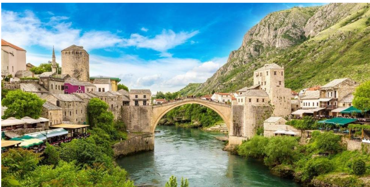
Fig. 1 Stari Most e città vecchia, Mostar, monumento iscritto alla Lista Patrimonio dell'Umanità dal 2005.