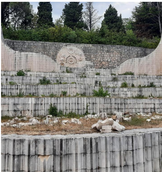
Fig. 2 Partizansko groblje, Mostar (luglio 2022). Sono evidenti i segni delle recenti distruzioni sul monumento di Bogdanović.