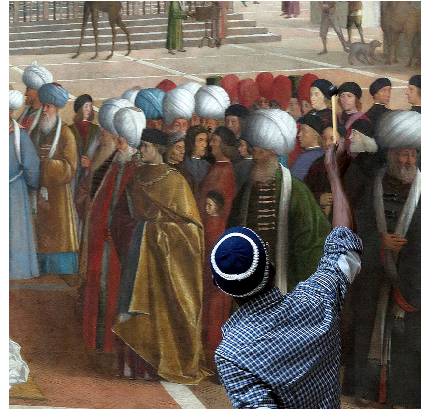
Fig. 5. "Brera: un'altra storia", promosso dalla Pinacoteca di Brera, 2012-2014, uno dei percorsi di visita guidati dai mediatori.