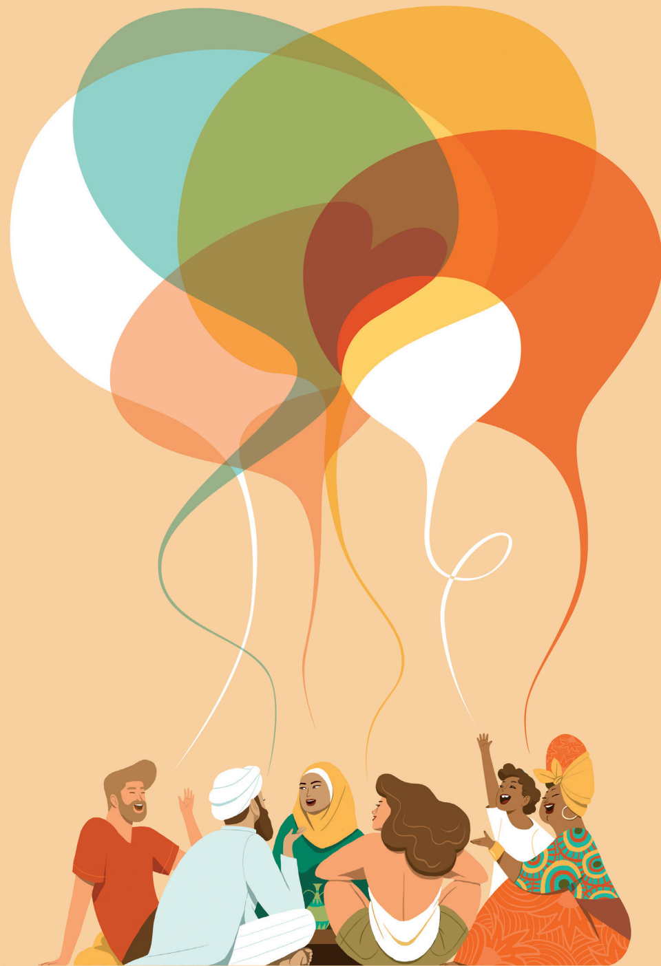
Fig. 1. "La teoria degli insiemi", Valentina Lorizzo, 2019, illustrazione realizzata per "Just Humans: 100 illustrazioni senza confini", Graphic Days 2019 Torino. Crediti: Valentina Lorizzo.