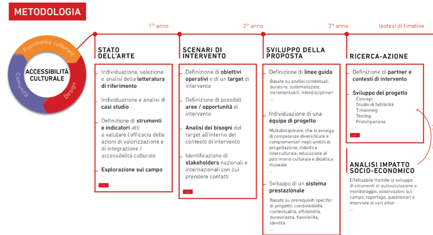
Fig. 3. Schema metodologico del percorso di ricerca. Crediti: Irene Caputo.