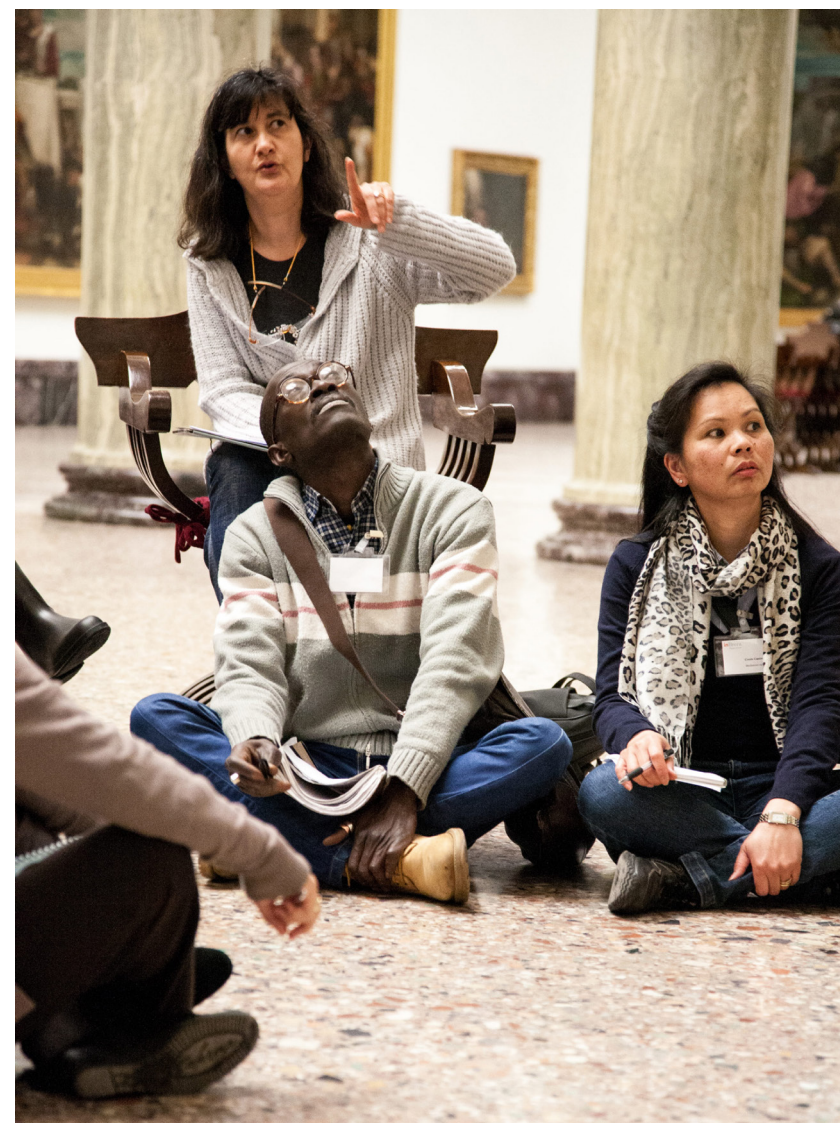
Fig. 2. "Brera: un'altra storia", promosso dalla Pinacoteca di Brera, 2012-2014, Percorsi interculturali nel museo.