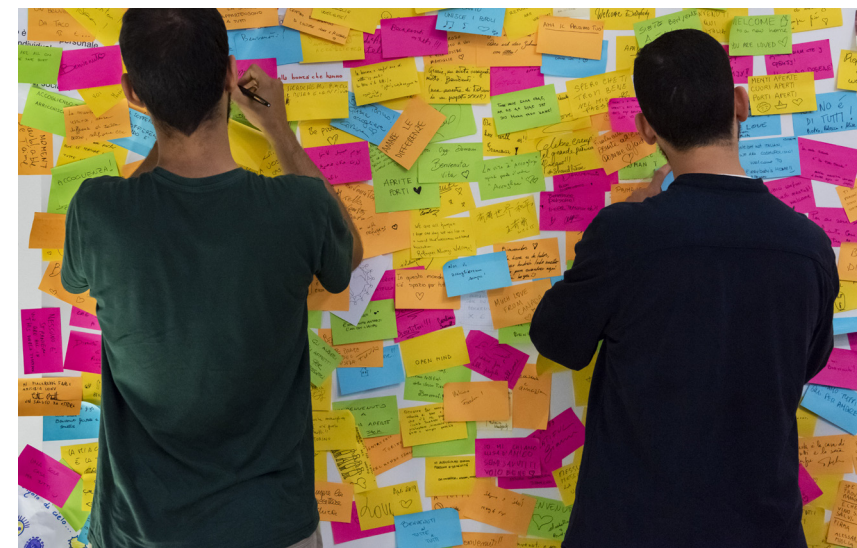
Fig. 6. "Io sono benvenuto", promosso dal Museo Egizio di Torino, 2017-in corso, Welcome Wall.