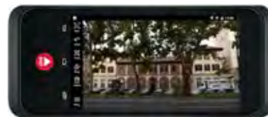
Figura 1 Alcuni strumenti utilizzabili per il rilievo speditivo dei fronti.