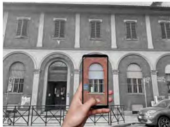
Figura 3 Esempio di rilievo speditivo di un fronte mediante app.