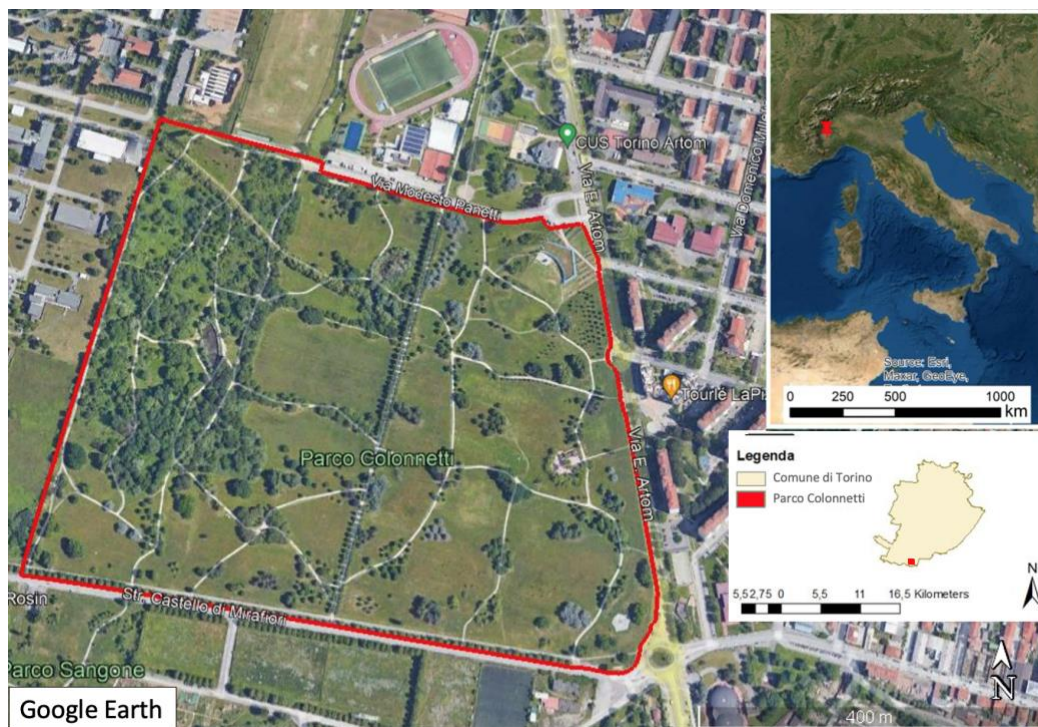
Figura 1. Inquadramento geografico del parco “Colonnetti”

Per l’analisi svolta è stato utilizzato i-Tree Eco , un programma appartenente alla suite i-Tree , una raccolta di strumenti di analisi forestale sviluppati dal Servizio Forestale degli Stati Uniti, volta a quantificare i Servizi Ecosistemici forniti da un’area di diverse dimensioni (dal quartiere ad un’intera città). In particolare, i-Tree Eco fornisce informazioni sulla struttura del verde urbano e sui suoi benefici ambientali, realizzando una stima di (i) inquinamento atmosferico rimosso ( O_3 , SO_2 , NO_2 , CO , PM_{10} , PM_{2.5} ), (ii) sequestro e stoccaggio di carbonio, (iii) deflusso idrico superficiale evitato, (iv) produzione di O_2 .