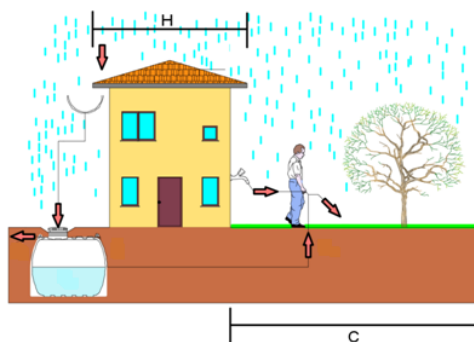
Figura 1. Schema del sistema di raccolta dell'acqua piovana: H area di captazione, C area irrigata.

Il metodo sinteticamente esposto è stato applicato al caso di studio della cittadina appenninica di Celano (AQ), posta alla quota di 800 m s.l.m. (Butera et al., 2021). Tra i diversi tipi di coltura che sono stati analizzati, è stato riportato nei grafici il caso di un semplice prato.