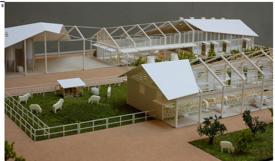
Fig. 8 Dettagli del modello in scala realizzato per illustrare la stalla sostenibile (esposto a Expo Milano 2015).