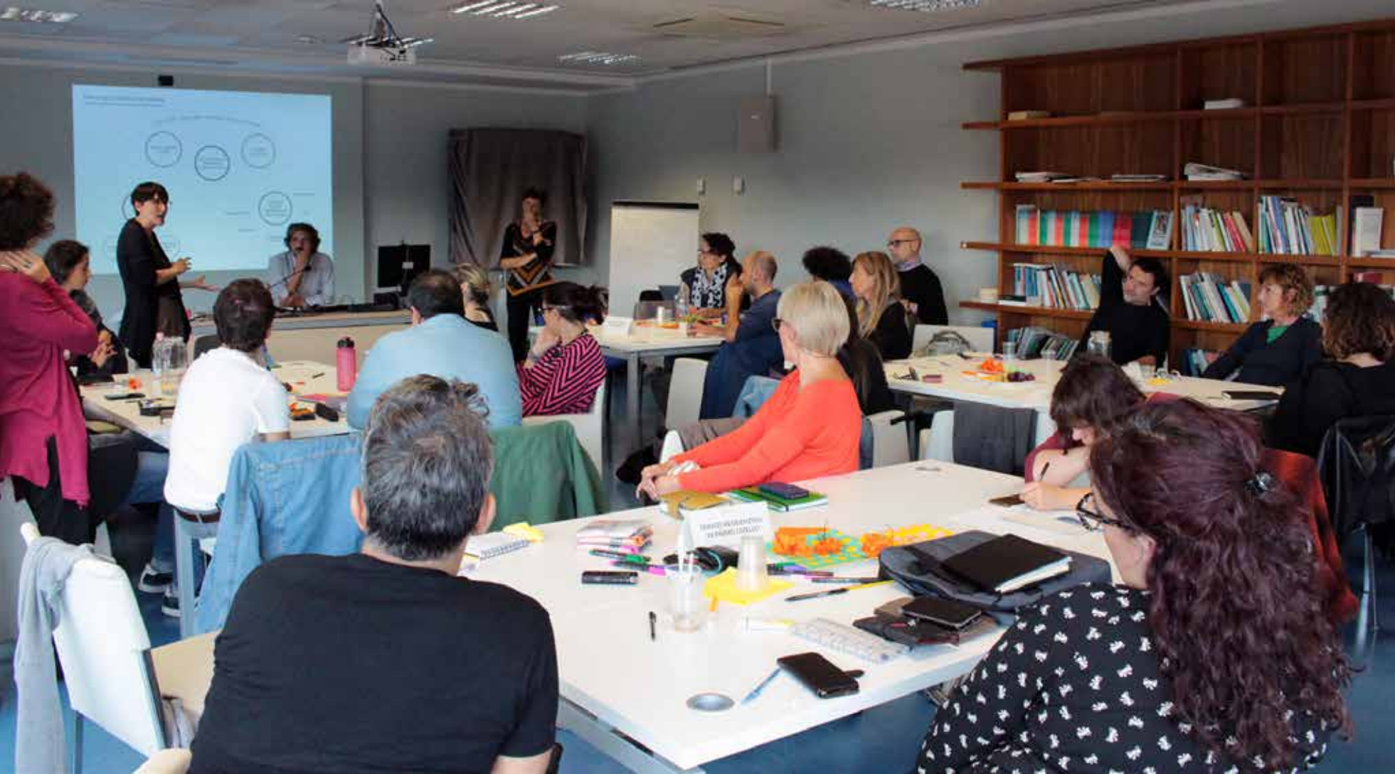
fig.3 Attività partecipativa di co-progettazione con i diversi attori del sistema dei servizi facilitata dal gruppo di ricerca interdisciplinare.