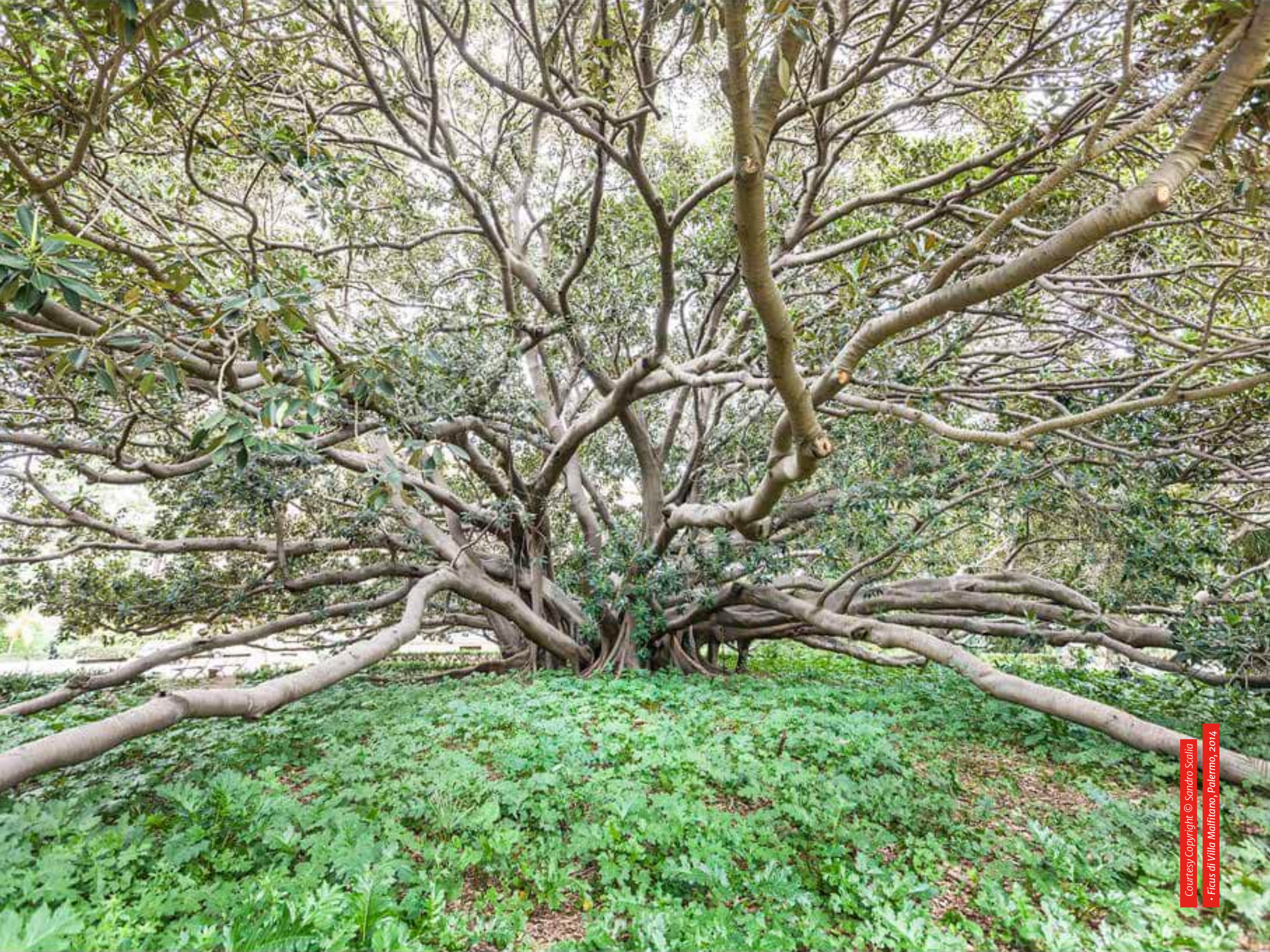
Ficus di Villa Malfitano, Palermo, 2014