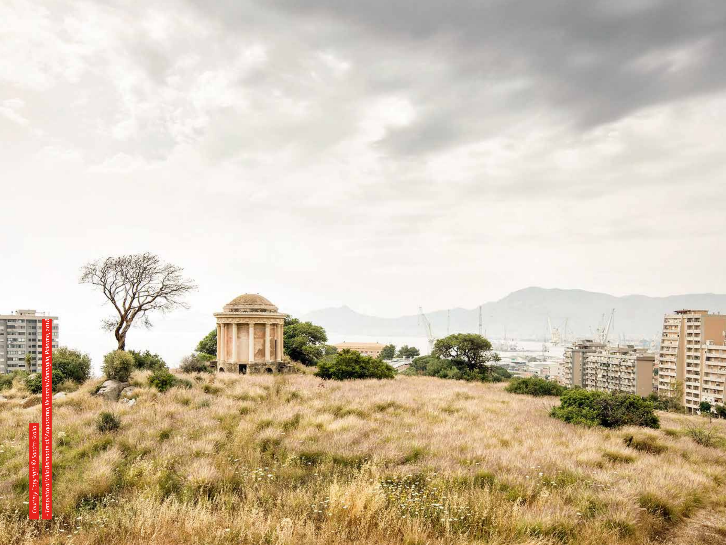
Tempio di Villa Belmonte all'Acquasanta, Venanzio Marvuglia, Palermo, 2018