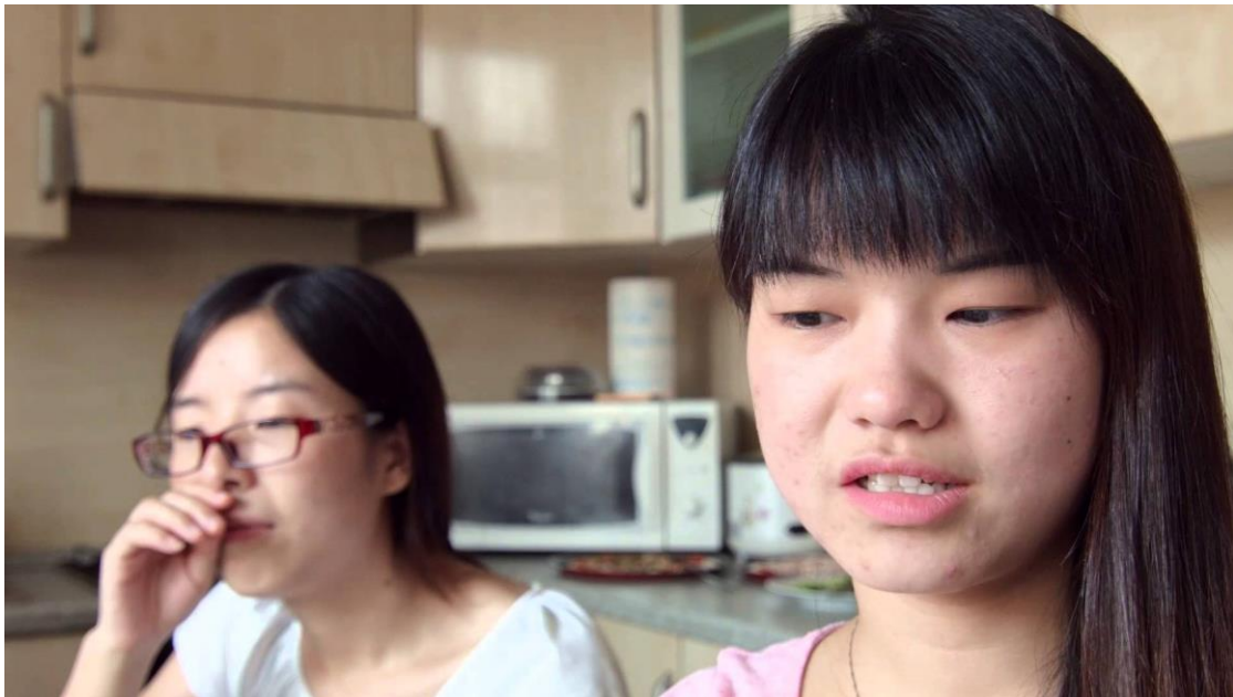
Fig. 5 – Fotografia del progetto Alloggiarmi (Fonte: archivio immagini Fondazione di Comunità di Miraorti).

Un reticolo di movimenti urbani minori s'inserisce dunque come un nuovo attore delle trasformazioni sociali, attivando nuove forme di welfare "fai da te" fortemente territorializzate, in risposta ad un disfacimento delle forme universalistiche di supporto sociale che hanno accompagnato la società dagli anni '70. La patrimonializzazione, che, è stata intesa per anni come garanzia per il futuro da un lato, acquisizione di consenso dall'altro, redistribuzione di ricchezza dall'altro ancora, oggi diviene, a forza, condizione per nuovi giochi (Harvey D., 1991). Questa iniziativa, che nella sua applicazione ha contraddetto le progettualità in atto, ha permesso un nuovo racconto per un quartiere che pensava ormai di essere ingabbiato in un processo di conservazione che ne incrementava l'isolamento.