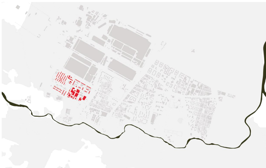
Fig. 4– Mappa che mostra la disposizione e consistenza del complesso residenziale della GESCAL.

Dopo questa prima esperienza si sono susseguiti altri progetti che ad opera di attori minori e con diverse competenze e obiettivi, hanno cercato di trovare una nuova identità al quartiere, che ha mostrato la voglia di spogliarsi dell'immagine grigia di company town per valorizzare il proprio capitale sociale e spaziale al di fuori del suo passato. Si sono susseguiti quindi diversi progetti, tra i quali anche il progetto Alloggiarmi, realizzato all'interno negli spazi del complesso di edilizia residenziale situato tra C.so Unione Sovietica, Via Plava, Via Anselmetti e Strada del Drosso.