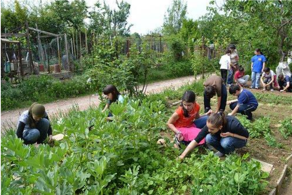
Fig. 3– Fotografia del progetto Miraorti.

L'obiettivo principale del progetto è costruire degli orti urbani nelle aree ripariali del fiume, fino ad allora spazi attrezzati come discariche abusive e attività illecite. Approfittando del processo di bonifica, gestito dal Comune di Torino e dalla Provincia, delle sponde ripariali del Sangone, il progetto si è occupato di dividere gli spazi a ridosso del fiume e attrezzarli per poi restituirli alla comunità locale che attraverso una manifestazione pubblica di interesse, poteva proporre come coltivare e gestire il proprio orto. Il progetto, inizialmente di dimensioni molto ridotte, praticamente senza budget e autorganizzato, diventa presto una delle best practice a cui guardare non solo all'interno dei confini comunali. La città decide di estendere il progetto a gran parte del Parco sul Sangone, di promuovere le