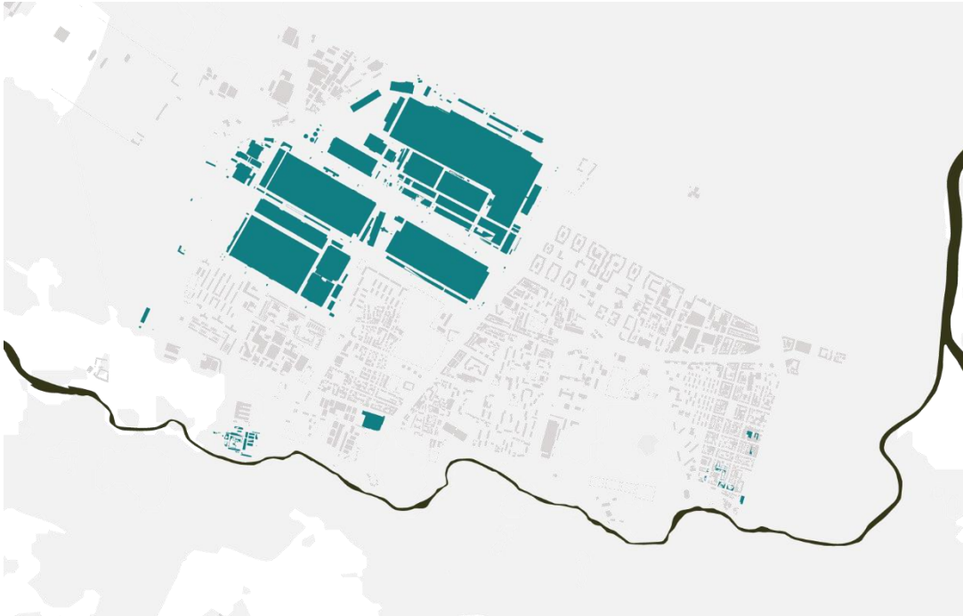
Fig. 2– Mappa che illustra l'importanza in termini spaziali della fabbrica rispetto al Quartiere.