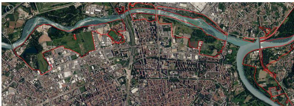
Figura 1. Il tratto urbano della Stura di Lanzo con l'evidenziazione dei parchi urbani e fluviali da Basse di Stura a Colletta alla confluenza nel Po

A questo sistema di tipo assiale si sovrappongono le rive fluviali della Stura, della Dora, del Sangone, composte da elementi con andamento quasi ortogonale al sistema delle richiamate assialità e