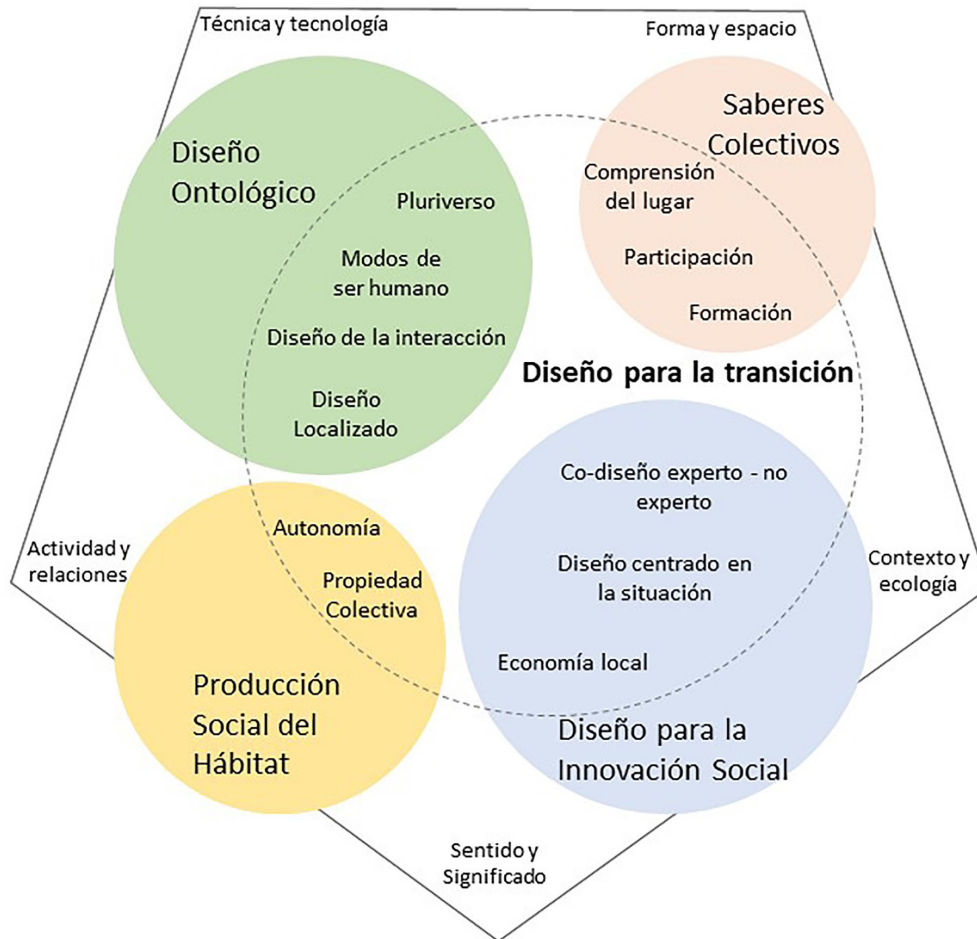
Figura 4. Aportes al diseño para la transición desde algunas prácticas de diseño relacionadas

Una práctica emergente surgida en América Latina como respuesta a las rupturas asociadas a la transición es la producción social del hábitat. Esta se plantea como un proceso alternativo y viable a los modelos de vivienda controlados por el estado y las grandes constructoras privadas que no contemplan la participación de los habitantes y que, con frecuencia, tampoco garantizan una vivienda adecuada. Por el contrario, estos procesos presentan escenarios de participación comunitaria que promueven la autonomía, la autogestión y la propiedad colectiva. “Para millones de personas, se trata de una alternativa, a veces la única, para convertir en realidad el acceso a un derecho social fundamental como es la vivienda adecuada” (Coalición Internacional para el Hábitat - oficina para América Latina HIC-AL, 2017, p. 9). La producción social del hábitat es, en consecuencia, “una de las disciplinas llamadas a la formulación de herramientas aplicables que permitan superar la desigualdad física y social del territorio urbano, lo que resulta de su entera competencia” (Sepúlveda, 2012, p. 155) y,