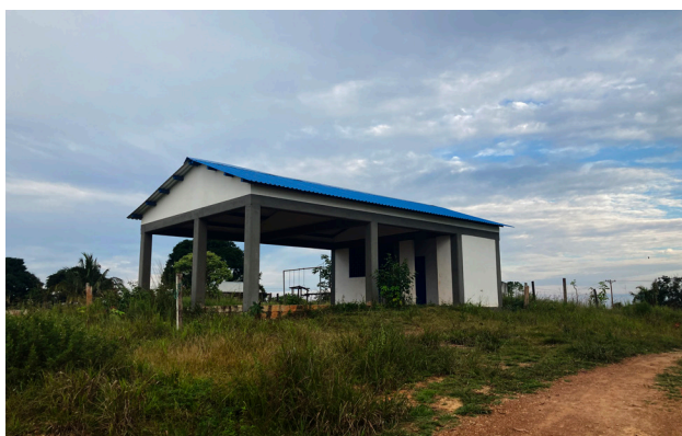
Figura 1. Caseta Comunitaria construida en el marco de los PDET en San José del Guaviare

mentos de implementación del Acuerdo de paz. En primer lugar, los Programas de Desarrollo con Enfoque Territorial -PDET- definidos por la Agencia de Renovación del Territorio (2021) como instrumentos especiales de “planificación y gestión a 15 años, que tienen como objetivo estabilizar y transformar los territorios más afectados por la violencia, la pobreza, las economías ilícitas y la debilidad institucional, y así lograr el desarrollo rural que requieren estos 170 municipios” (Agencia de Renovación del Territorio, 2021). Por medio de estos programas, el gobierno colombiano ha llevado a cabo diferentes obras de mejoramiento de escuelas, diseño y construcción de baterías sanitarias, parques y casetas comunitarias.