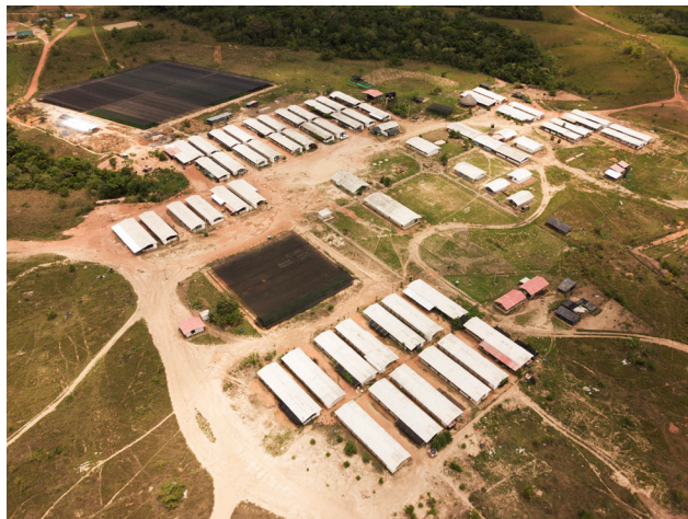
Figura 3. ETCR Marco Aurelio Buendía, San José del Guaviare

El uso de herramientas para la acción y la participación en el diseño ha sido recurrente también en el diseño para la innovación social, una disciplina en evolución cuyos objetivos abordan ámbitos como lo social, lo cultural y la economía local (Irwin, 2015, p. 230). El diseño para la innovación social parte del cuestionamiento sobre el papel del proyecto en sus