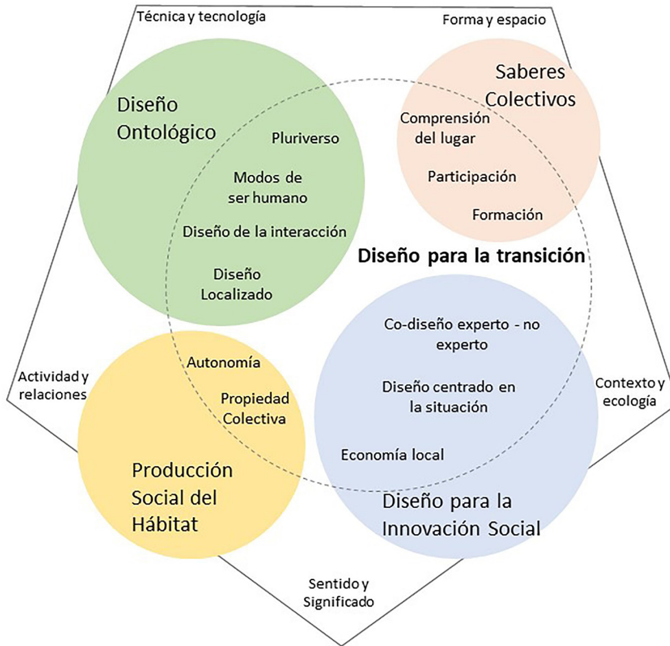
Figura 4. Aportes al diseño para la transición desde algunas prácticas de diseño relacionadas

Una práctica emergente surgida en América Latina como respuesta a las rupturas asociadas a la transición es la producción social del hábitat. Esta se plantea como un proceso alternativo y viable a los modelos de vivienda controlados por el estado y las grandes constructoras privadas que no contemplan la participación de los habitantes y que, con frecuencia, tampoco garantizan una vivienda adecuada. Por el contrario, estos procesos presentan escenarios de participación comunitaria que promueven la autonomía, la autogestión y la propiedad colectiva. “Para millones de personas, se trata de una alternativa, a veces la única, para convertir en realidad el acceso a un derecho social fundamental como es la vivienda adecuada” (Coalición Internacional para el Hábitat - oficina para América Latina HIC-AL, 2017, p. 9). La producción social del hábitat es, en consecuencia, “una de las disciplinas llamadas a la formulación de herramientas aplicables que permitan superar la desigualdad física y social del territorio urbano, lo que resulta de su entera competencia” (Sepúlveda, 2012, p. 155) y,