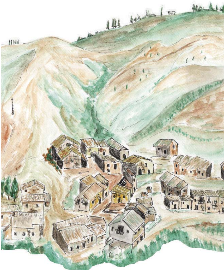
Fig. 1 Acquerello raffigurante la cunziria.

Vizzini è un piccolo comune della Città metropolitana di Catania, di circa 6000 abitanti. Sorge su un costone di montagna, dove gli edifici si sono "arroccati" a formare una cresta abitata.