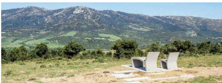
Figura 2 Una vista suggestiva: per enfatizzare la vista sulla necropoli antropomorfa, le cui sepolture sono scavate nella roccia della montagna antistante, vengono collocate delle sedute orientate e integrate al contesto naturale. Fotografia di Jesús Granada, reperibile nel documento relativo al progetto per l'Ensenada de Bolonia, p. 29

inteso come barriera fisica e visiva, ma come elemento che accresce il valore delle rovine romane e parallelamente si elabora una nuova immagine correlata del museo archeologico, inserendo pannelli informativi e arredi urbani uniformati e più efficaci nella divulgazione di contenuti per i visitatori [figg. 4-5].