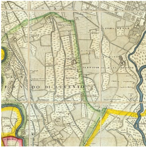
4: Stralcio relativo alle proprietà extraurbane del Marchese di Barolo nella Carta corografica dimostrativa del Territorio della città di Torino e dei suoi contorni , 1791 [ASCT, Collezione Simeom, D 1800].