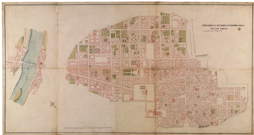
3: Copia della Carta dell'interiore della città di Torino che comprende ancora il Borgo di Po, 1760 circa [Archivio di Stato di Torino, Corte, Carte Topografiche per A e B, Torino 16].

1986] o il piano di Richard Horwood per Londra del 1795 come preludio agli Ordnance Survey e altre carte la cui conoscenza si stava diffondendo in modo rapido sia in Italia sia in Europa [Boutier 2005; Curcio 2008; Folin 2010].