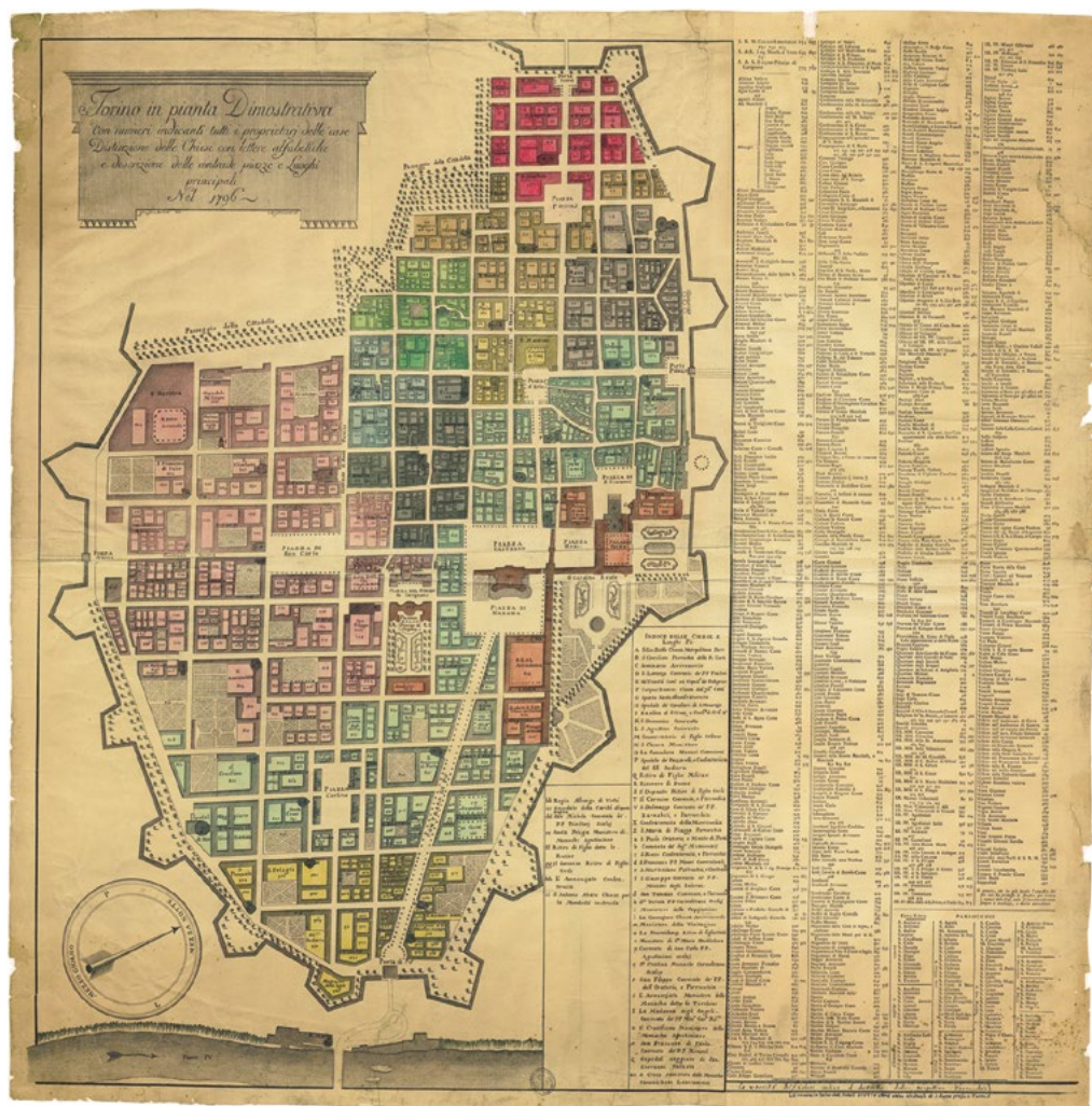
2: Torino in pianta dimostrativa, con numeri indicanti tutti i proprietari delle case [...], 1796.

sfruttamento agricolo del territorio. Per comprendere meglio il valore del lavoro di Grossi è interessante notare come per ciascun bene sia indicato, oltre alla minuziosa descrizione di edificio e annessi e al toponimo più comune, frutto delle denominazioni stratificatesi nel tempo, anche il nome degli attuali proprietari e l'indirizzo della loro residenza urbana stabile; la successiva pubblicazione della Pianta di Torino del 1796 4 con l'elenco delle proprietà renderà immediatamente praticabile un incrocio globale di