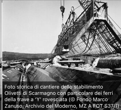
Foto storica di cantiere dello stabilimento Olivetti di Scarmagno con particolare dei ferri della trave a 'Y' rovesciata