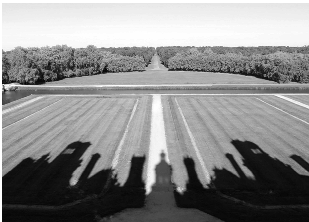
Fig. 3 Il parterre nord e la grande prospettiva François 1 er del castello di Chambord prima dei recenti ripristini. Foto dell'autore, settembre 2006.

vi contribuiti di provata qualità. Eppure dalla presente ricognizione di interventi su sedimi di giardini scomparsi emergono alcune rilevanti sperimentazioni, sorta di «rarefazioni concettuali» 11 in cui il giardino diviene metafora estetica e assume un carattere narrativo che – adattando all'oggetto indagato le parole di Turri – si può definire iconemico: