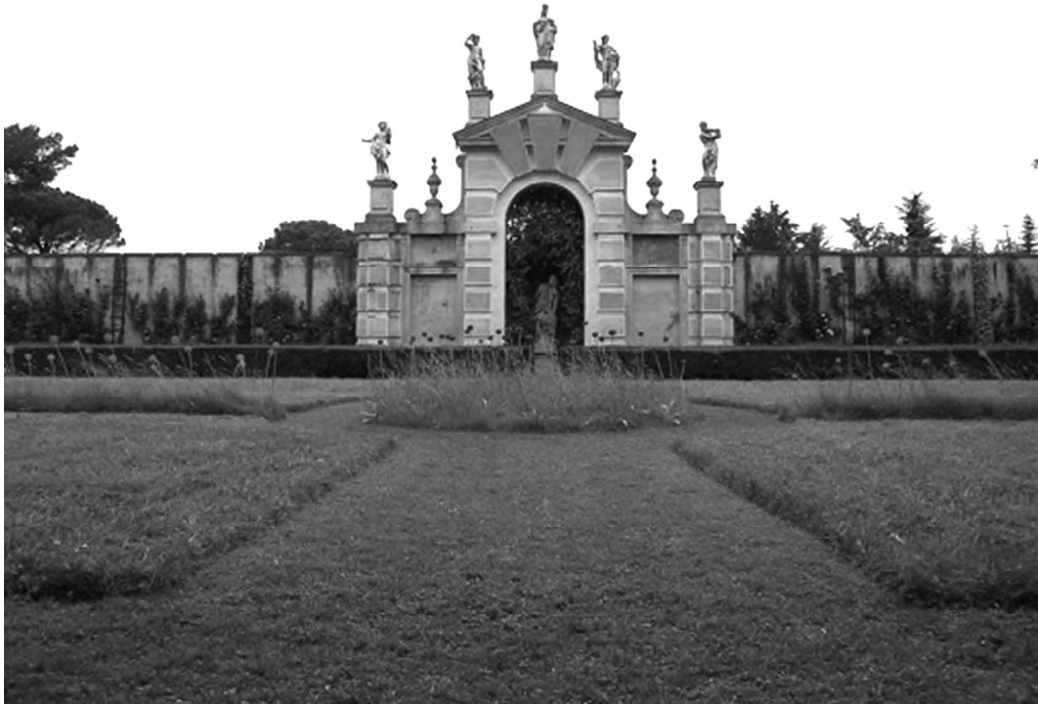
Fig. 6 Il «parterre di fiorita» nei giardini di Villa Pisani a Stra. Foto dell'autore, giugno 2000.