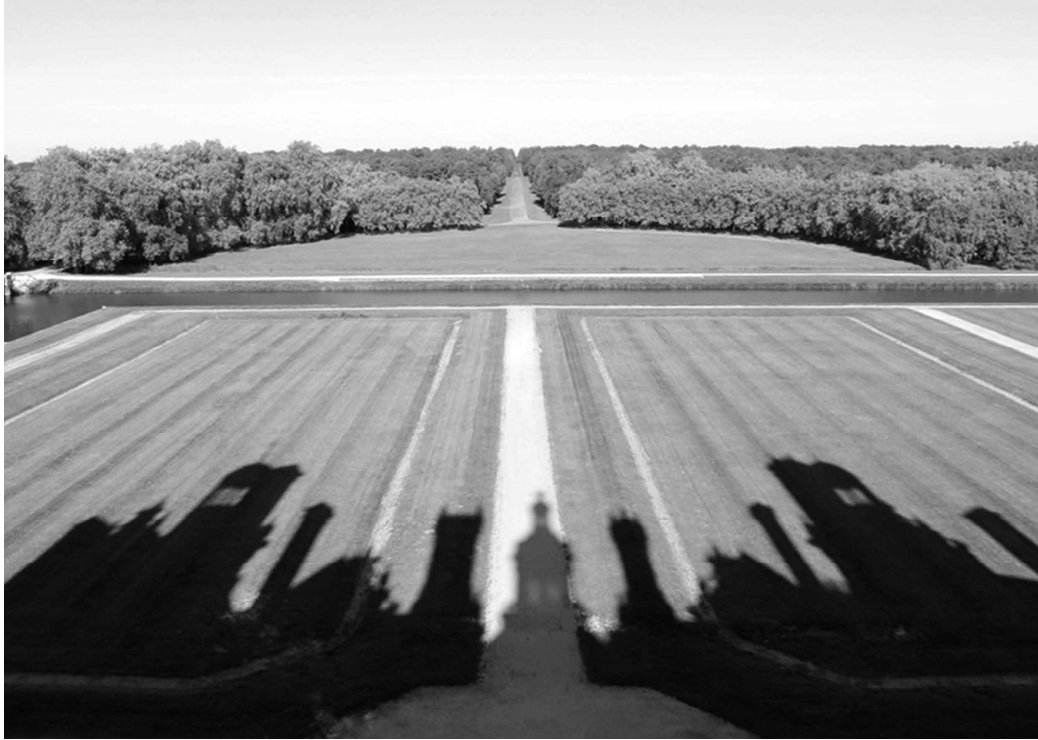
Fig. 3 Il parterre nord e la grande prospettiva François 1 er del castello di Chambord prima dei recenti ripristini. Foto dell'autore, settembre 2006.

vi contribuiti di provata qualità. Eppure dalla presente ricognizione di interventi su sedimi di giardini scomparsi emergono alcune rilevanti sperimentazioni, sorta di «rarefazioni concettuali» 11 in cui il giardino diviene metafora estetica e assume un carattere narrativo che – adattando all'oggetto indagato le parole di Turri – si può definire iconemico: