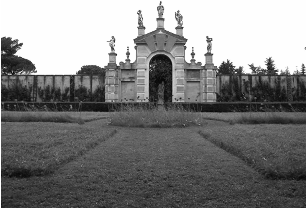
Fig. 6 Il «parterre di fiorita» nei giardini di Villa Pisani a Stra. Foto dell'autore, giugno 2000.