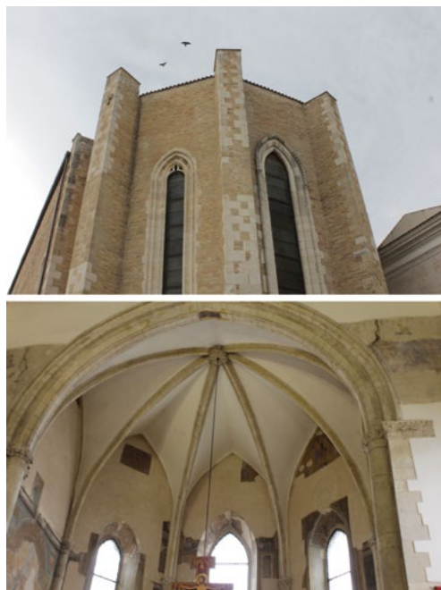
5: Veduta verso l'abside della chiesa di San Francesco a Lucera. Esterno e interno.

angioina. Le soluzioni stilistiche sono paragonabili a differenti elementi di dettaglio dei portali della cattedrale lucerina (in seguito all'analisi delle modanature e dei capitelli è stata ipotizzata la presenza di maestranze autoctone e abruzzesi) [Rossi 2015, 47; Bruzelius 2005, 124].