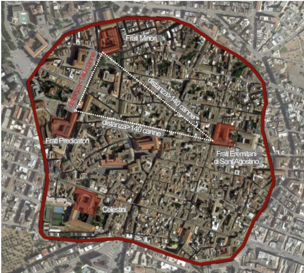
3: Vista aerea con indicazione approssimativa delle distanze tra i conventi [Elaborazione dell'autrice].

volta a crociera su pianta poligonale a 5/10 e costolonata ma anche nella soluzione del capitello della semicolonna dell'arco trionfale che si estende oltre questa sul muro adiacente e infine nella presenza di una nicchia ( piscina ) posta nella stessa posizione, anche se con soluzioni stilistiche leggermente diverse.