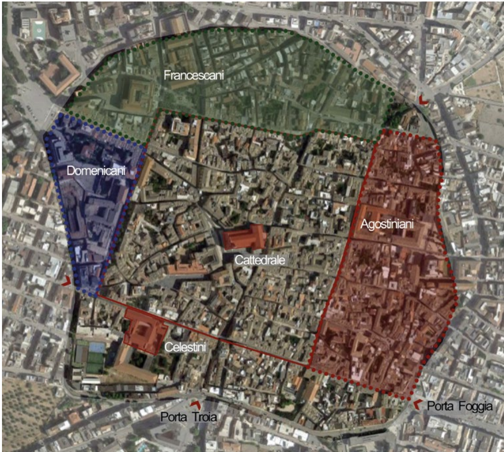
2: Vista aerea con possibile indicazione dell'area di pertinenza dei conventi [Elaborazione dell'autrice].

nonché per la nuova cattedrale 3 [Egidi 1917] (Considerando le trasformazioni subite dai complessi conventuali nel corso dei secoli il contributo prenderà in esame solamente la questione degli edifici ecclesiastici annessi ai conventi degli ordini citati).