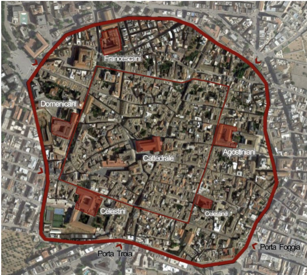
1: Vista aerea con indicazione rettangolo cattedrale e conventi [Elaborazione dell'autrice].

A tal proposito la posizione delle chiese e dei relativi conventi sembrerebbe non essere casuale ma frutto di una precisa volontà del sovrano: un programmatico riordino indirizzato all'occupazione di alcuni punti strategici lungo il perimetro urbano per mezzo dell'edificazione di conventi asserviti alle nuove intenzioni di governo (Fig. 1).