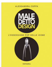
Maledetto design. L'ossessione pop delle icone Alessandra Coppa Centauria, Milano, 2019

Beautiful and Damned The icons of contemporary design, cult objects that represent the most popular stylistic movements, nowadays increasingly appear in our homes, in our bookcases, on the desks of our offices. These objects, which have become almost a “designer’s and architect’s” fetish, are flanked by as many small obsessions, manias or simple recursive approaches of their creators, established designers but human in their funny oddities. A little of all this, and the “curse” of design that makes it so fascinating and attractive, is investigated in “Maledetto Design. L’ossessione pop delle icone”.*