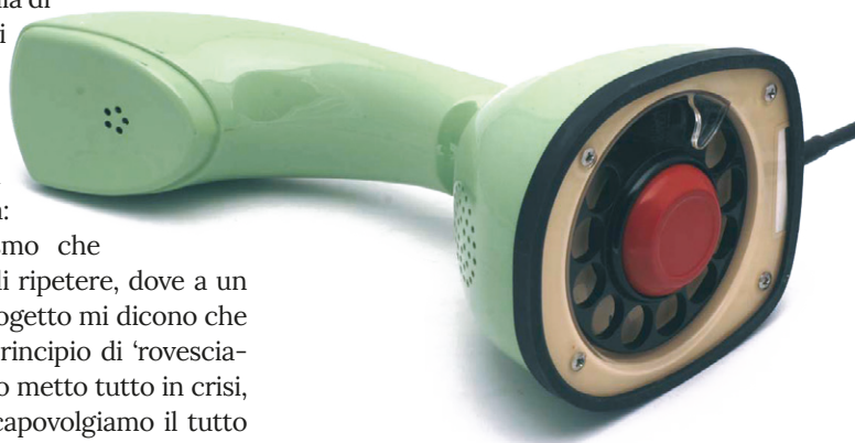
01. Il telefono per ambienti istituzionali Ericofon