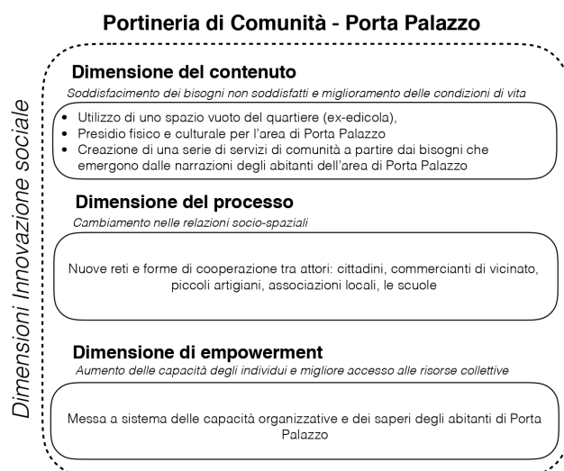
Tabella 2 | La Portineria di Comunità e le tre dimensioni dell'innovazione sociale di Moulaert et al. 2010, e di Choi e Majumdar (2015) (elaborazione dell'autrice)

Riprendendo le tre caratteristiche fondamentali dell'innovazione sociale definite da Moulaert et al. 2010, e da Choi e Majumdar (2015) si può affermare che la Portineria di comunità soddisfa alcuni bisogni locali precedentemente non soddisfatti, modifica le relazioni socio-spaziali tra gli attori locali creando nuove reti, ed è un volano per l' empowerment degli abitanti del quartiere che non sono semplici utilizzatori passivi, bensì veri e propri co-creatori del progetto grazie alle competenze che mettono a disposizione della comunità. Una buona pratica che potrebbe diventare un modello replicabile anche in altre aree di Torino e in altre città italiane.