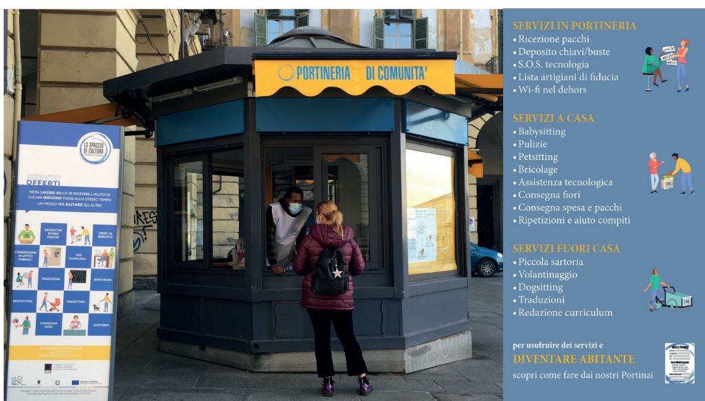
Figura 1 | La portineria di comunità e i servizi offerti

L'obiettivo è creare delle micro-forme di economia umana attraverso i servizi che la Portineria offre: 6 servizi in loco (proprio come una vera portineria, ad esempio si possono lasciare chiavi o ricevere pacchi), 15 servizi itineranti dal dogsitting alle traduzioni di lingua, e 10 servizi a domicilio, tra cui la consegna a casa della spesa, piccoli lavori di bricolage e sartoria o babysitting (si veda la Figura 1 nella pagina seguente). Per usufruire dei servizi della Portineria di comunità bisogna diventare «Abitanti», ovvero sottoscrivere una tessera con un prezzo simbolico che include una parte dei servizi offerti dalla Portineria, in alternativa sul sito internet o in Portineria si possono acquistare i singoli servizi: da quelli base a quelli che richiedono un preventivo, come il servizio di pulizie a casa o il babysitting . A poco più di 8 mesi dall'avvio del progetto gli 'abitanti' sono già oltre 200, tra cittadini comuni, commercianti, artigiani e associazioni. A gestire una parte dei servizi come la spesa a domicilio o il pagamento delle bollette per chi non può spostarsi sono due «Portinai» regolarmente assunti per aiutare la comunità di Porta Palazzo e non solo, visto che il raggio di azione dei servizi della Portineria si sta progressivamente estendendo a tutta la città.