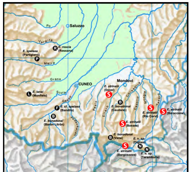
Fig. 9 - Le stazioni di Eukoenenia strinatii (in rosso) fra quelle delle specie del genere Eukoenenia attualmente conosciute in Piemonte (tratto da Balestra et al. , 2019, modificato).

In ambiente sotterraneo il concetto di "rarietà" di una specie è strettamente correlato alla conoscenza di chi esegue le ricerche: osservazioni attente del comportamento in natura sono indizi utili per poterla trovare in condizioni ambientali simili; una specie come Eukoenenia strinatii , considerata per decenni rarissima e limitata al solo sistema sotterraneo di Bossea è invece risultata presente in altre cavità delle Alpi Liguri, dalla Valle Ellero alla Valle Tanaro (vedi fig. 9).