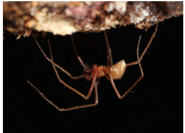
Fig. 3 - Troglohyphantes pedemontanus (Gozo, 1908).

La successiva descrizione di una nuova entità topotipica di Bossea risale al 1908 sul “Bullettino della Società entomologica italiana” da parte di Angela Gozo e riguarda il Troglohyphantes pedemontanus (Gozo, 1908) (fig. 3) un ragno “troglobio” con notevole specializzazione alla vita sotterranea, descritto come “ Porrhomma pedemontanus ”, considerato un endemita esclusivo di Bossea per tutto il secolo scorso finché ne abbiamo allargato l'areale dalla Valle Corsaglia alla Valle Tanaro, con 4 nuove stazioni a partire dal 2008, esattamente un secolo dopo la descrizione della specie (Isaia et al. , 2011; Lana et al. , 2020).