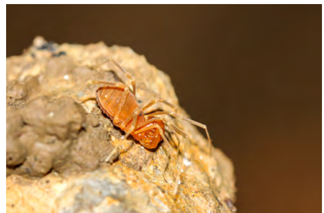
Fig. 5 - Holoscotolemon oreophilum Martens, 1978.

La bibliografia relativa ai record faunistici è stata consultata sui testi originali (cartacei o in formato .pdf) e in rari casi su CD (es. Bodon et al. , 2007).