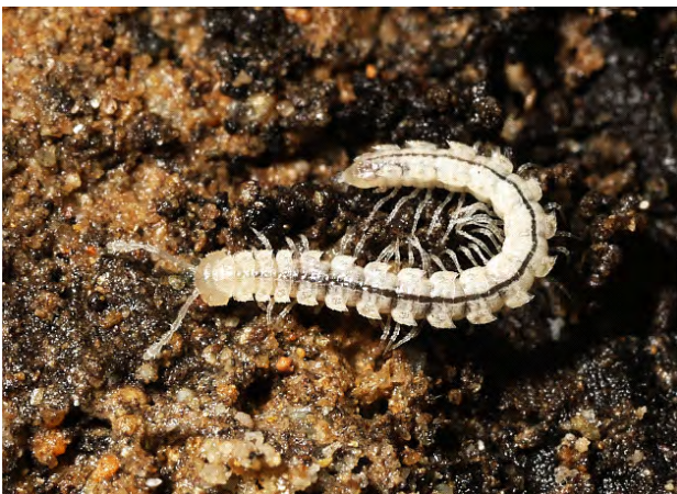
Fig. 2 - Polydesmus troglobius (Latzel, 1889).

A cavallo tra '800 e '900, con l'apertura alle visite turistiche (1874), la Grotta di Bossea (fig.1) è stata visitata da ricercatori e specialisti dell'epoca che vi hanno svolto assidue ricerche faunistiche. La prima descrizione formale di una nuova specie per la cavità risale al 1889, ad opera di R. Latzel sul Bollettino del Museo civico di Storia Naturale di Genova e riguarda il diplopode Polydesmus troglobius (Latzel, 1889) (fig. 2), di cui la grotta è il locus typicus , poi trovato durante il secolo successivo in altre cavità del Piemonte meridionale.