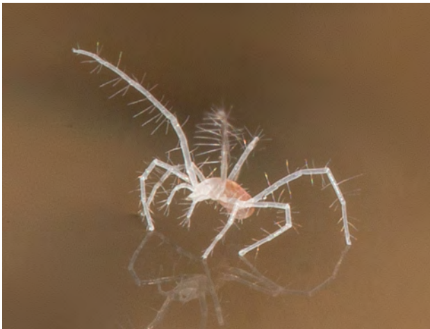
Fig. 4 - Troglolcheles lanai Zacharda, 2011.

Ricerche “classiche” assidue in ambiente ipogeo, sia a Bossea che in altre cavità del Piemonte, riassunte in numerosi contributi (Casale & Giachino, 1994, 1996, 1997, 1998; Casale et al. , 1999, 2000; Lana, 2000, 2002, 2005, 2013; Lana et al. , 2001, 2002, 2003, 2004, 2006, 2007, 2008, 2009, 2010, 2011; Balestra & Lana, 2017), hanno permesso sia di aggiornare la lista faunistica della Grotta di Bossea sia di trovare in altre valli nuove stazioni di specie considerate endemiche della Valle Corsaglia. Ma la “svolta” si è per noi attuata negli ultimi 12 anni, nei quali l’esperienza sul campo è stata supportata dalla documentazione bibliografica e si è operata una mutazione della mentalità di ricerca: abbiamo cominciato a ragionare sul concetto di “fauna sotterranea” (vedi sopra).