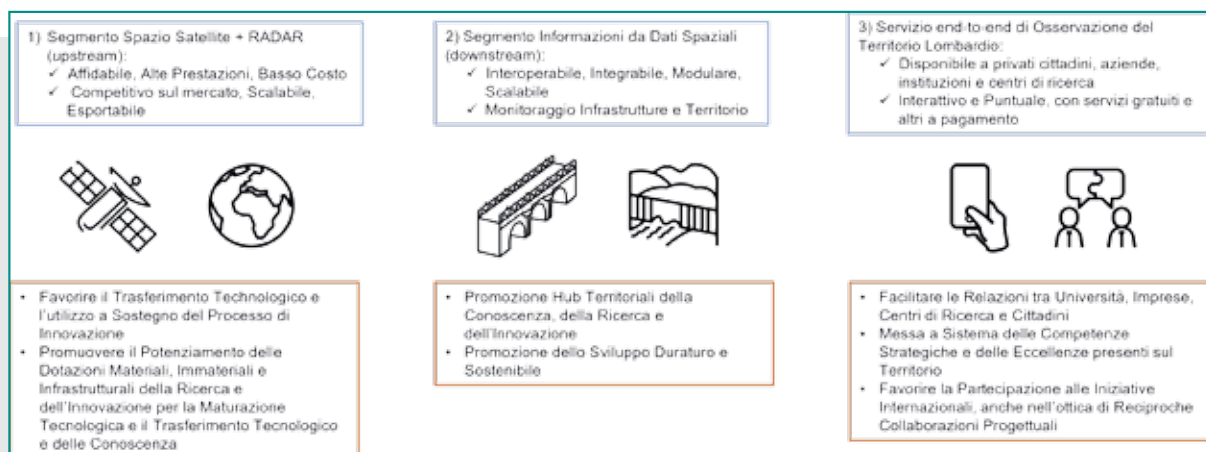
Fig. 3 - Obiettivi di progetto (blu) Vs Obiettivi strategici (rosso).

Ciò permetterà di superare quelle difficoltà tipiche dal complesso processo di accesso, acquisizione ed elaborazione dei dati SAR grezzi, emerse anche nel contesto del programma europeo Copernicus dove la difficoltà appunto nell'accesso/acquisizione del dato, unito alla frammentazione del mercato, alla difficoltà nel collegare e far incontrare in modo efficiente domanda e offerta di prodotti e servizi offerti (Andrea Taramelli, De Bernardinis, and Castellani 2020), risultano essere alcuni dei principali problemi del programma, limitando il vero sviluppo dell'enorme mercato downstream ad esso collegato.