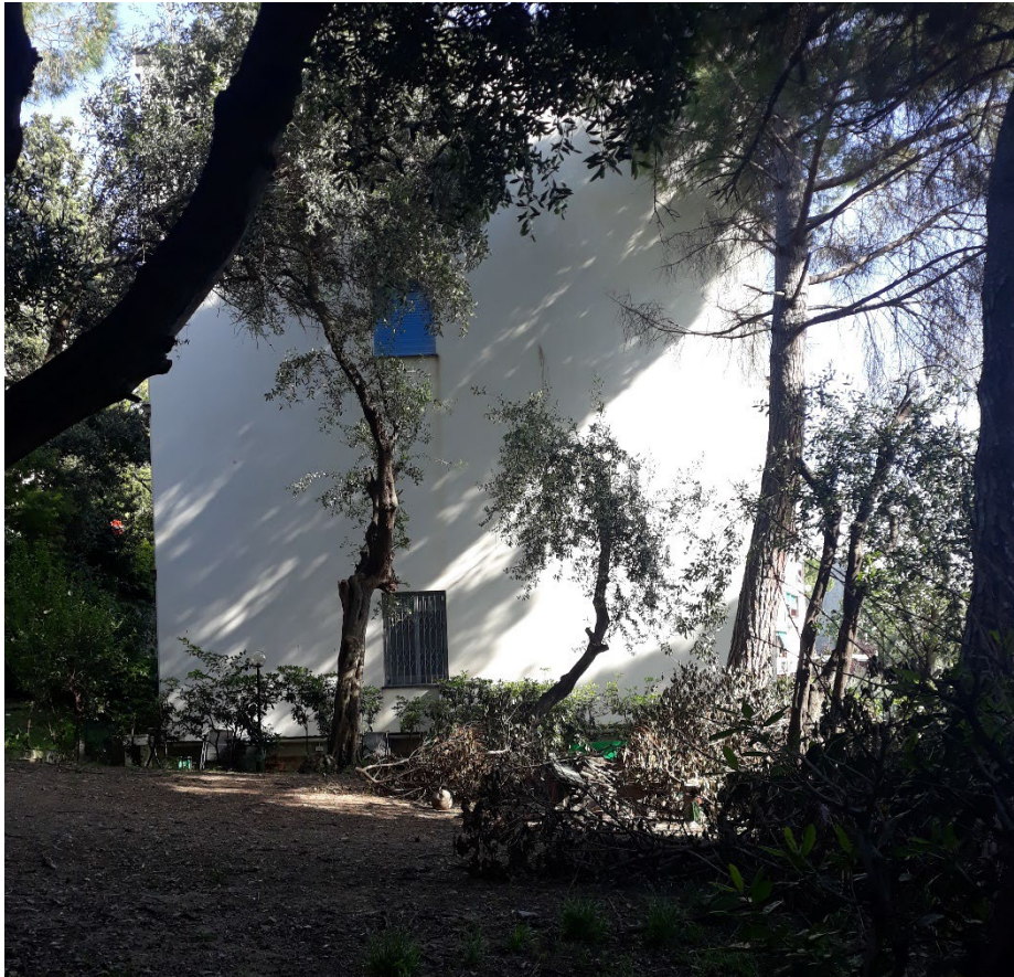
Figura 4 | L.C. Daneri, (capogruppo per la progettazione urbanistica), quartiere Bernabò Brea, Genova. Fonte: autore, maggio 2019

ponente cittadino ha potenziato la propria vocazione portuale e industriale, il levante ha mantenuto il suo carattere residenziale articolato intorno ai nuclei identitari dei piccoli centri esistenti, vicini alla costa (Balletti, Giontoni 1990). Il tutto è accaduto dentro un generale aumento potenzialmente ubiquo delle costruzioni, condizionate dalle preesistenze e dall'orografia segnata dalle forti pendenze e dalla diversità di esposizione dei versanti.