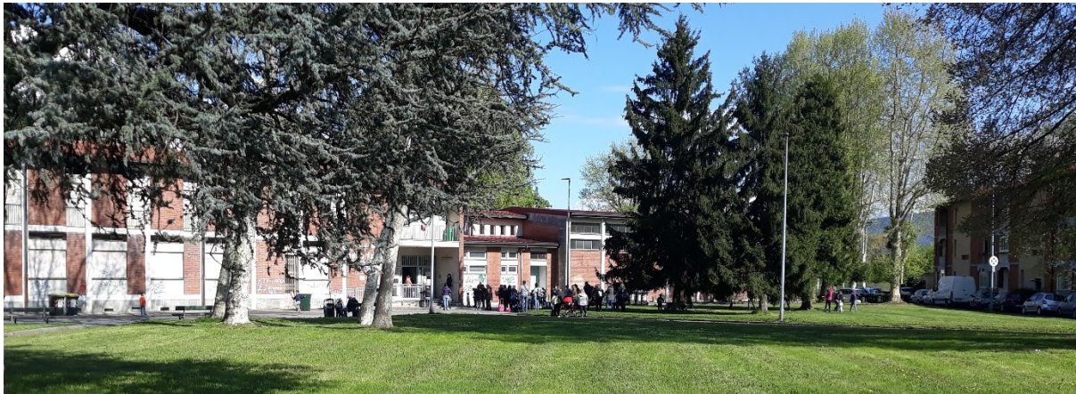
Figura 2 | G. Astengo (capogruppo per la progettazione urbanistica), Falchera, Torino. L'uscita pomeridiana dalla scuola elementare Fonte: autore, aprile 2019

La condizione periferica appare prodotta dai rapporti di produzione attivi, che non vengono messi fondamentalmente in discussione dalla disarticolazione della catena produttiva. Tuttavia, si cerca di abradere alcune conseguenze palesi dello sviluppo.