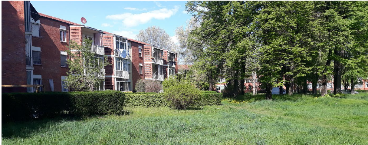
Figura 1 | G.Astengo (capogruppo per la progettazione urbanistica), G.Becker, G.F.Fasana, autori dell'edificio, Falchera, Torino

Passa a minore importanza rispetto al Novecento e al fronte di ricerca della modernità, il rapporto tra piani e progetti locali e piani e progetti esemplari, capaci di porre a un livello disciplinare la fondazione del proprio fare. Lo stato presente dell'architettura e dell'urbanistica poteva essere posto come una elaborazione autonoma in riferimento allo spirito del tempo e alla civilizzazione produttivista, elaborazione peraltro aperta, mai raggiunta come acquisizione definitiva.