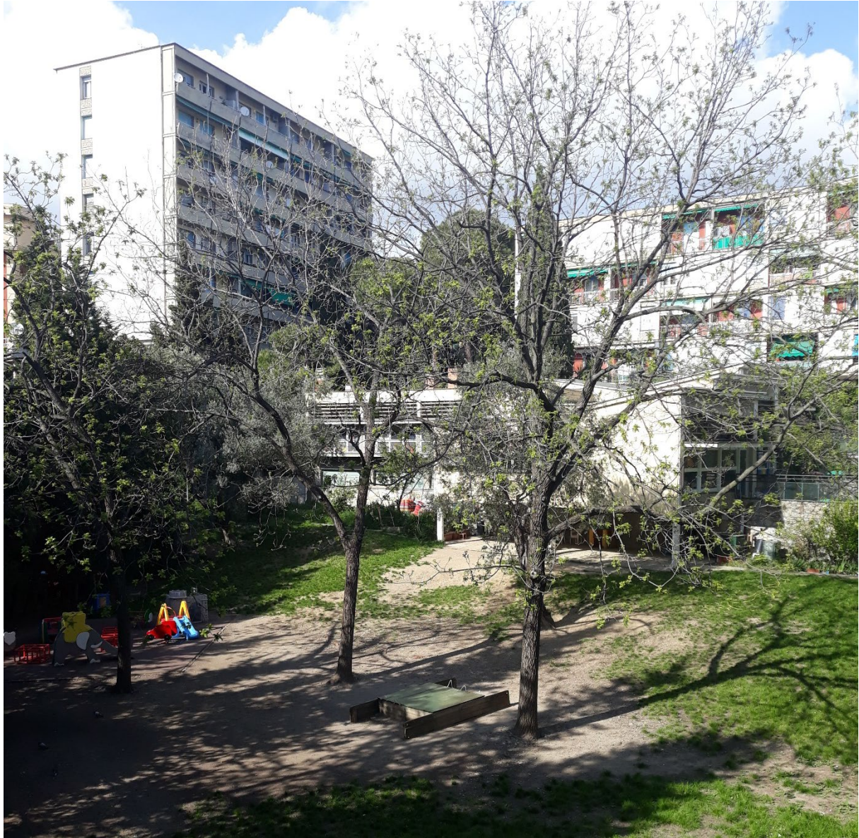
Figura 5 | L.C. Daneri, (capogruppo per la progettazione urbanistica), L.C. Daneri, progetto architettonico dell'edificio alto e della scuola materna, quartiere Bernabò Brea, Genova.

vuoto, sabbiato dalla collocazione marginale e da pratiche che si accendono solo saltuariamente (Maguolo, 2015). La grande distribuzione e i concessionari d'auto hanno preferito localizzazioni più vicine al centro città e più dense di popolazione, o la prossimità alla tangenziale.