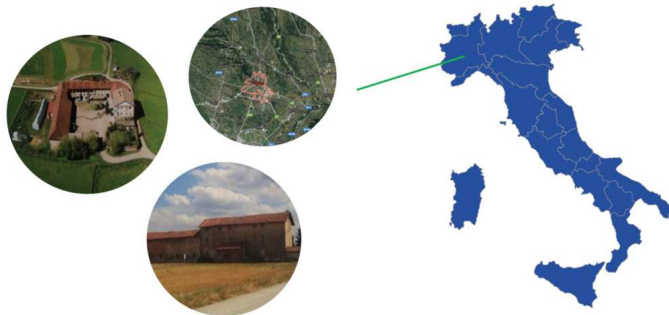
Fig. 3 - Il contesto di applicazione: il sistema delle cascine storiche nell’area periurbana del comune di Volpiano (TO).

Il caso è stato presentato in occasione di due conferenze internazionali [8, 22]: in esso i processi analitici e decisionali di supporto alle politiche di rigenerazione urbana e valorizzazione dei contesti periurbani sono stati condotti adottando una prospettiva originale e innovativa, ovvero impiegando inizialmente i principi di responsabilità sociale d’impresa [8] per poi integrarli con i paradigmi dell’approccio social impact-oriented [22].