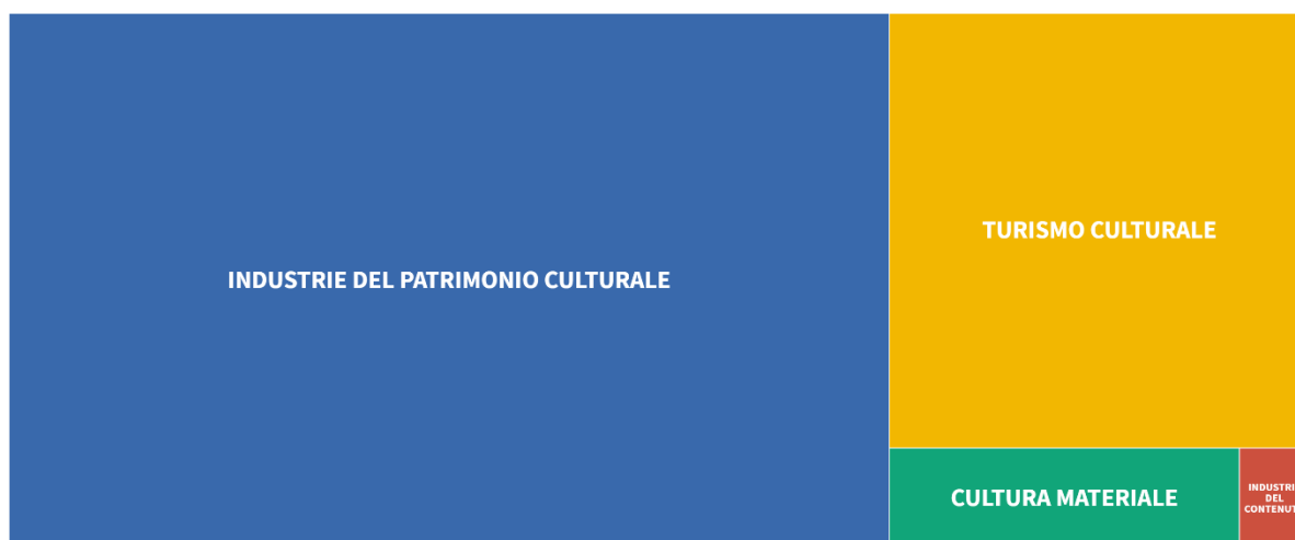
Figura 2 – Settore prevalente nelle attività progettuali dall'analisi dei progetti candidati nelle edizioni 2011-2014.

I progetti candidati prevedono attività per la maggior parte incluse nel settore delle industrie del patrimonio culturale, settore a cui faceva esplicito riferimento il bando. È tuttavia interessante notare come gli altri settori in cui i progetti candidati agiscono sono il turismo culturale e la cultura materiale (Figura 2).