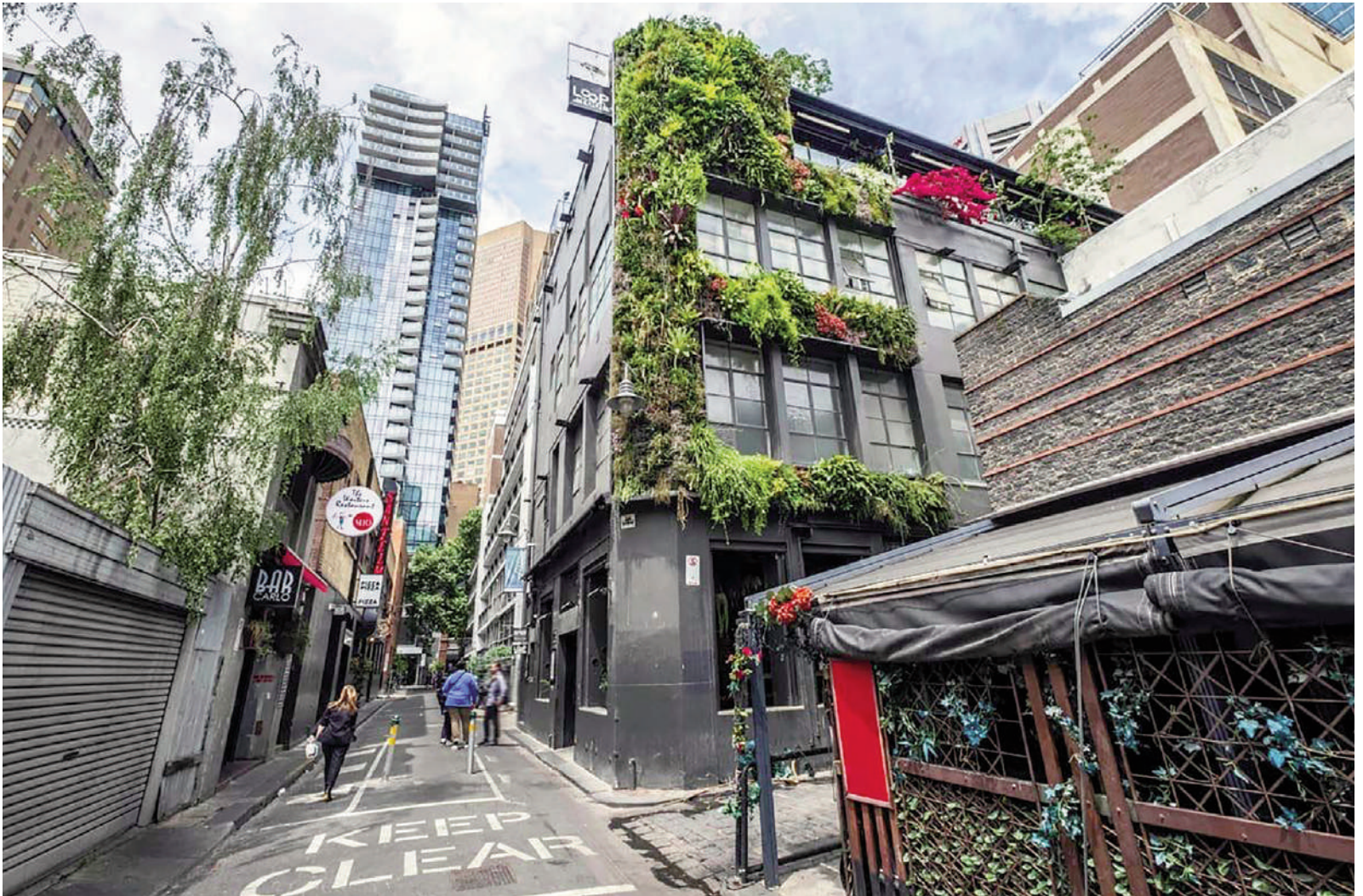
Fig. 5 | Edgware Road Tube Station Living Wall in London by Biotecture, 2011.