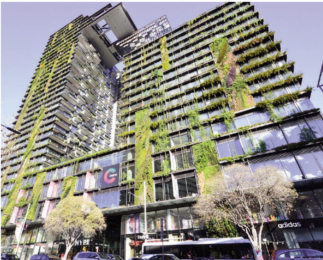
Fig. 7 | MFO Park in Zurich Nord by Burckhardt+Partner and Raderschallpartner, 2003 (credit: Joachim Kohler Bremen, 2013).