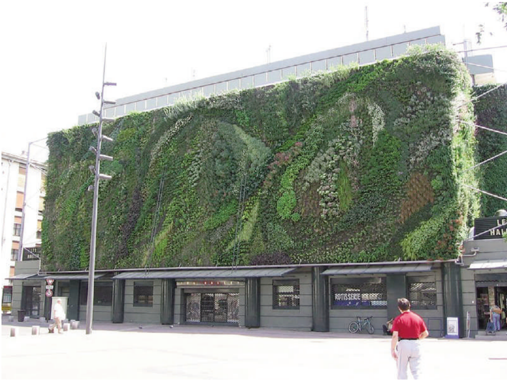
Fig. 1 | Mur Végétal in Halles by Patrick Blanc, 2006.

viadotto Minhocão a São Paulo a firma dello studio franco-brasiliano Triptyque Architecture nel 2015. Il progetto, ideato in collaborazione con l'architetto paesaggista Guil Blanche, prevede l'uso di verde verticale e pensile a integrazione della struttura di sostegno di un tratto del sottopasso autostradale. Anche in questo caso la scelta della vegetazione è un aspetto fondamentale della proposta progettuale: le pareti verdi di tipo rampicante sono costituite in gran parte da Hedera helix , specie vegetale che ha dimostrato buone capacità di assorbimento del particolato atmosferico PM10 (Sternberg et alii, 2010).