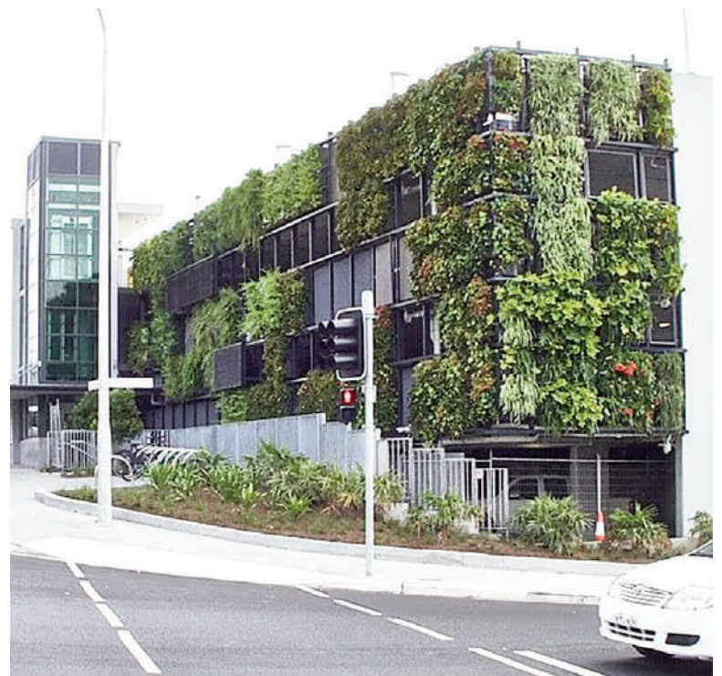
Fig. 4 | Junglefy Breathing Walls™ on the Manly Vale Car Park in Sydney, 2018.