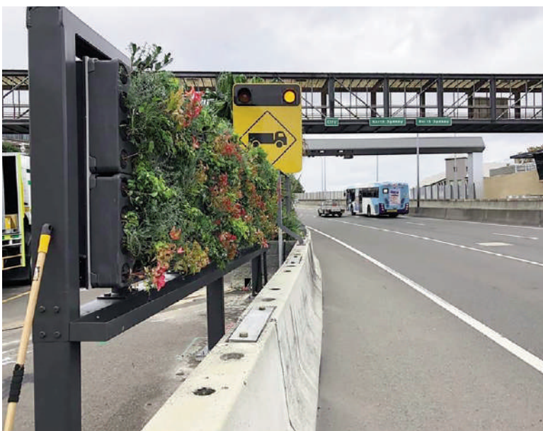
Fig. 3 | Junglefy Breathing Walls™ installed along the Transurban Easter Distributor Motorway in Sydney, 2019.

This 'biophilic' design approach (Marshall and Williams, 2019) proposes the use of greenery as a strategy to reactivate resilient processes within densely built-up realities (Forman, 2014). The LUSH (Landscaping for Urban Spaces and High-rises) programme introduced by the city of Singapore in 2009 is a good example of how this approach can be adopted to shape an Urban Development Plan in which nature becomes a design tool itself. The programme takes advantage of the growth of the urban fabric to create new green spaces through the adoption