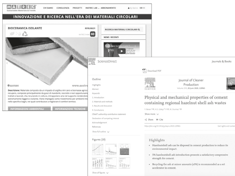
Figura 3 - Scheda prodotto (MATREC - SX) e scheda studio sperimentale (ScienceDirect - DX) di sottoprodotti della filiera corilicola [Elaborazione J. Andreotti].

alizzate, dall'altro i materiali sperimentali, esito di studi e ricerche. Gli strumenti utilizzati per la ricognizione sono stati le virtual library (es. Matrec, Material Connexion, ecc.) e le principali piattaforme di divulgazione scientifica (es. ScienceDirect, Google Scholar, ecc.). L'attività di studio e catalogazione di materiali e prodotti, restituita attraverso l'elaborazione di schede prodotto (fig.3), si è delineata come prodromica per la successiva individuazione di scenari di reimpiego e di sperimentazione. Nel caso degli scarti della nocciola, per esempio, la cuticola, in virtù dell'elevato contenuto di polifenoli e antiossidanti, è oggetto di studi a livello internazionale [Yuan, 2018], la cui estrazione potrebbe favorire lo sviluppo di nuovi prodotti a uso umano nei settori farmaceutico, cosmetico e alimentare. Nel campo dell'edilizia interessanti sperimentazioni sono state con-