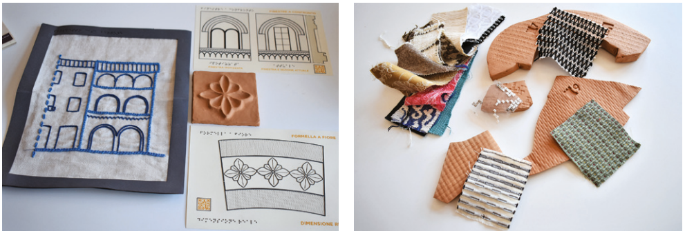
Fig. 02 Uso degli elementi identitari del luogo, l'argilla e il tessuto, per la realizzazione di ausili di mediazione.

vità che l'individuo compie e i nessi che ne derivano, siano finalizzate non solo per se stessi, ma soprattutto verso gli altri. Potremmo quasi dire thinking by doing for all , un apprendimento esperienziale che non si pone come autoreferenziale ma ha come obiettivo il coinvolgimento dei bisogni dell'intera comunità. Fondamentale risulta, quindi, il lavorare in gruppo, con tutti i fattori positivi della socializzazione e del cooperative learning , ad esso correlati. Ciascun componente del gruppo è invitato a compiere azioni in modo attivo e partecipativo, a fare uno sforzo cognitivo nel comprendere i valori sottesi all'azione in un costante confronto con gli altri, a effettuare le scelte sperimentando e facendo sperimentare i conseguenti risultati. Il coinvolgimento all'interno di un gruppo di lavoro di portatori di interessi diversi, non fa che arricchire l'esperienza e potenziare la metodologia di apprendimento.