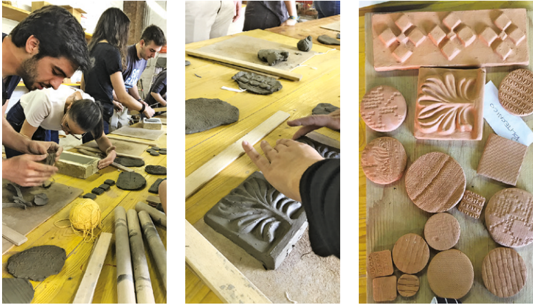
Fig. 01 Esperienze di manipolazione e di riconoscimento di un elemento identitario del luogo: l'argilla.

tutti” ( Design for All ) nei programmi di istruzione e formazione per le professioni interessate” 7 al fine di poter raggiungere gli obiettivi della stessa Convenzione.