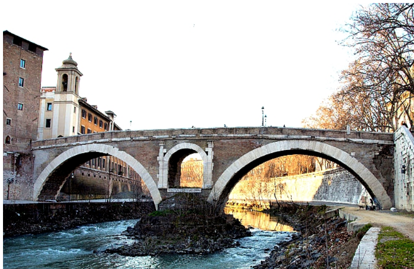
Figure 4: Pons Fabricius.