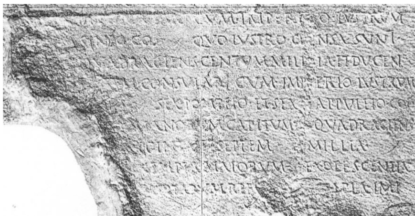
Figure 3: Una parte delle Res gestae Divi Augusti sul Monumentum Ancyranum, il Tempio di Augusto e Roma in Ancyra, oggi Ankara. La versione del testo di Ancyra è quella più completa tra tutte quelle rinvenute.

Nel 64 a.C. la Galazia divenne un regno cliente della Repubblica romana, mantenendo la suddivisione in tre tribù (ciascuna delle quali con a capo un tetrarca). Al tempo di Cesare, uno dei tre tetrarchi, Deiotaro, prese il sopravvento e divenne re. Dopo Deiotaro, il figlio Aminta, comandante ausiliario dell'esercito romano di Bruto e Cassio e che aveva guadagnato il favore di Marco Antonio, divenne il basileus della Galazia. Con la morte di Aminta (25 a.C.), la Galazia fu incorporata nell'impero da Augusto. Pilamene, figlio di Aminta, ricostruì un tempio presso Ancyra dedicandolo ad Augusto in segno di lealtà all'impero. Sul muro del tempio sono incise le Res gestae Divi Augusti.