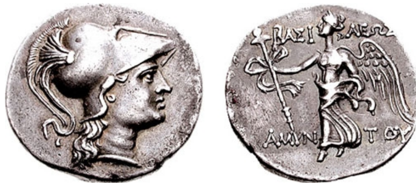
Figure 2: Amyntas, King of Galatia 36-25 BC

Il primo incarico ricevuto da Lollio, e che ci è noto, è il governatorato della Galazia, una nuova provincia dell'impero romano nell'Anatolia centrale. L'introduzione del governo romano nel contesto locale era un compito importante e difficile, e possiamo essere certi che Lollio deve essersi dimostrato un uomo capace - sottolinea Lendering - per ricevere un tal incarico di prestigio. Le carriere romane erano più o meno regolarizzate in un cursus honorum. Lollio poteva avere allora circa 31 anni, o essere un po' più vecchio. In ogni caso, doveva essere già stato questore, edile o tribuno e pretore prima di andare a est come governatore.