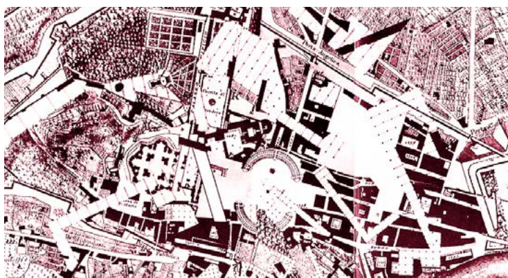
PRODUZIONE DELLA CARTA