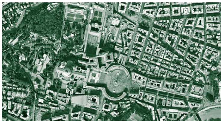
INTERPRETAZIONE PER SCHEMI