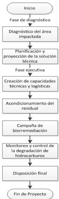
Figura 1 Diagrama de flujo de un PRAZCH

Se seleccionó como caso de estudio el proyecto “Rehabilitación ambiental integral de Punta Majagua”, zona que se localiza en una península del mismo nombre. Se ubica en la porción centro-norte de la bahía de Cienfuegos, Cuba. La presencia en el área de los restos de cuatro tanques con aproximadamente 371 m 3 de fuel oil y lodos de deposición de alta viscosidad, así como 108 m 3 de residual derramado en el suelo, tras el abandono de las instalaciones de la Unidad Distribuidora de Combustibles de Cienfuegos, provocaron la contaminación de aproximadamente 30 000 m 2 del ambiente objeto de análisis 10,11 . Laboraron indistintamente en las actividades del proyecto, un total de 40 trabajadores.