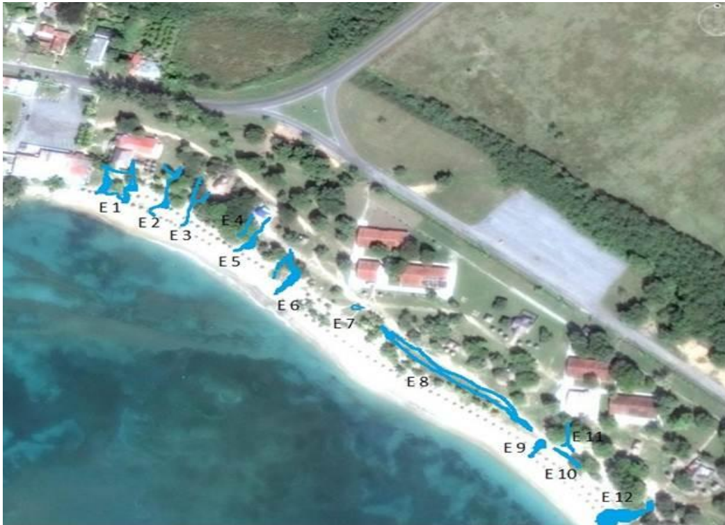
Figura 2. Localización de evidencias de erosión hídrica en la playa Rancho Luna

Gutiérrez et al. (2017) han demostrado que la playa Rancho Luna está severamente afectada por la erosión hídrica, predominando la erosión por arroyamiento del tipo cárcavas. En la figura 2 se muestra la localización de las 12 evidencias erosivas identificadas ( E_i , donde i=1, 2, \dots, 12 ) en el sector de principal de playa, con una longitud de franja costera aproximada de 640 m.