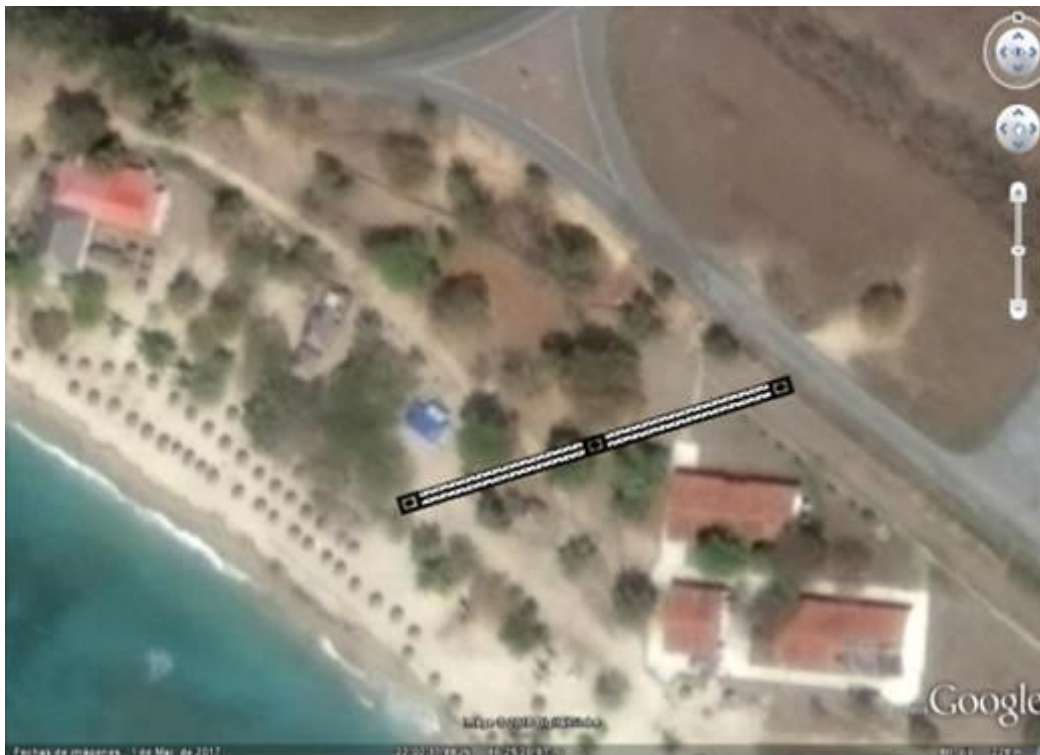
Figura 7. Localización de la zanja de infiltración propuesta para el sector S4

Según la información topográfica disponible del área propuesta para la zanja, obtenida del mapa topográfico de la playa Rancho Luna 1:500 (CEDIN 1999), se corroboró que las cotas del nivel del terreno son de 3,22 m a 3,82 m con respecto al nivel medio del mar. En la figura 7 se muestra la localización de la zanja de infiltración propuesta para el sector S4.