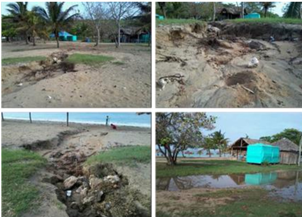
Figura 4. Evidencias gráficas de la magnitud de la erosión hídrica manifiesta en E6, asociada al sector de escorrentía S4 en la playa Rancho Luna