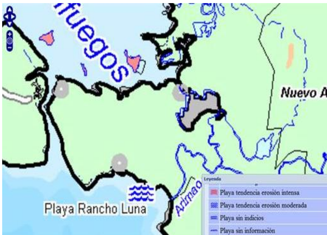
Figura 1. Clasificación erosiva de la playa Rancho Luna

La playa Rancho Luna, ubicada en la costa centro-sur de Cuba, al sur de la ciudad de Cienfuegos, tiene un largo de franja costera de aproximadamente 1 000 m y una orientación de su línea de costa de noroeste a sureste. Los estudios del Macroproyecto de Peligro y Vulnerabilidades Costeras 2050-2100 (CITMA 2010) clasifican a la playa Rancho Luna como una playa con tendencia a erosión moderada (figura 1).