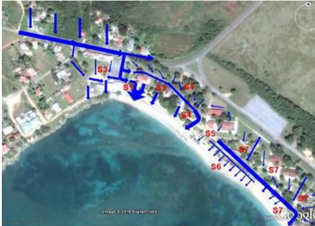
Figura 3. Sectores de escorrentías predominantes en el drenaje natural de la playa Rancho Luna