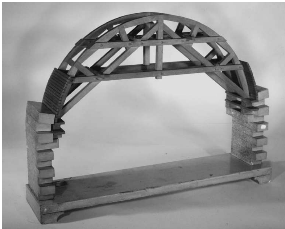
Fig. 5 – Laboratorio per la costruzione dei modelli dei cavv. Blotto e Vittorio Canepa Torino, Modello di armatura per la costruzione di grandi archi, XIX secolo (Politecnico di Torino, Dipartimento di Ingegneria Strutturale, Edile e Geotecnica, Collezione di modelli di costruzioni).

to, maestro di fochi ” (f. 50v), elencando così competenze e saperi che qualificano, come il suo scrivere, il suo disegnare e il suo agire, la sua personale interpretazione dell’ ingenium (Pedretti, 1978) vitruviano e poi rinascimentale.