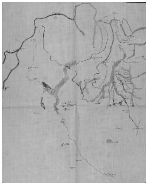
Fig. 2 – Gustavo Uzielli, Leonardo da Vinci. Viaggi sulle Alpi, s.d., in Biblioteca Nazionale Centrale di Firenze, fondo Gustavo Uzielli, striscia n. 131.

Sacco, invece, si occupa di storia della Terra soffermandosi sui fossili, i “nichi” di Leonardo, studia l’orografia dei luoghi citati dal Vinciano, l’andamento delle acque, dei fiumi e dei laghi e correda il suo contributo per la mostra del 1939 con immagini che riproducono la cartografia del Codice Atlantico e gli straordinari disegni ora nei fogli della raccolta reale di Windsor. Argomento noto al professore torinese, il disegno del territorio è oggetto degli approfondimenti di Uzielli che nei suoi quaderni di appunti schizza i “Viaggi sulle Alpi” di Leonardo localizzando le località a lui note sulle Alpi Occidentali, in Figura 2. Gli studi ottocenteschi sulla cartografia, rilevanti nella formazione dell’ingegnere civile, commentano poco i disegni leonardiani, privilegiando temi legati alla scienza idraulica, alla conformazione del suolo, alle tecniche di misura, alle strutture e considerano il Grande di Vinci un punto di separazione tra il metodo cartografico proprio dell’età antica e medievale e quello adottato nel periodo moderno, sintetizzati dall’approccio di Tolomeo e dalla riforma cartografica del XVI secolo. È Gerolamo Calvi a segnalare, nel 1909, la “Cosmographia” di Tolomeo come principale fonte di conoscenze geografiche del Vinciano che, infatti, ne conserva una copia nella sua biblioteca. Leonardo, inoltre, richiama specificatamente Tolomeo in un suo appunto, ora nel Manoscritto M, in cui sintetizza il metodo matematico per tracciare carte geografiche.