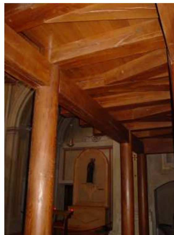
Particolare dell'orizzontamento di copertura