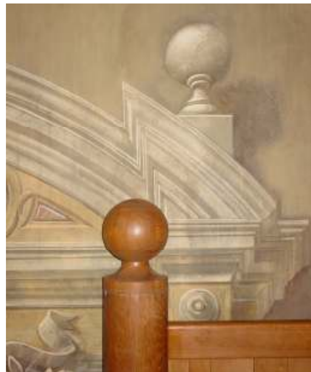
Coronamento del parapetto e decorazione