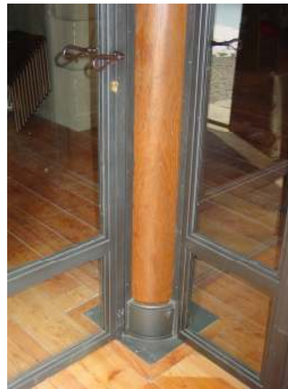
Particolare della bussola di accesso