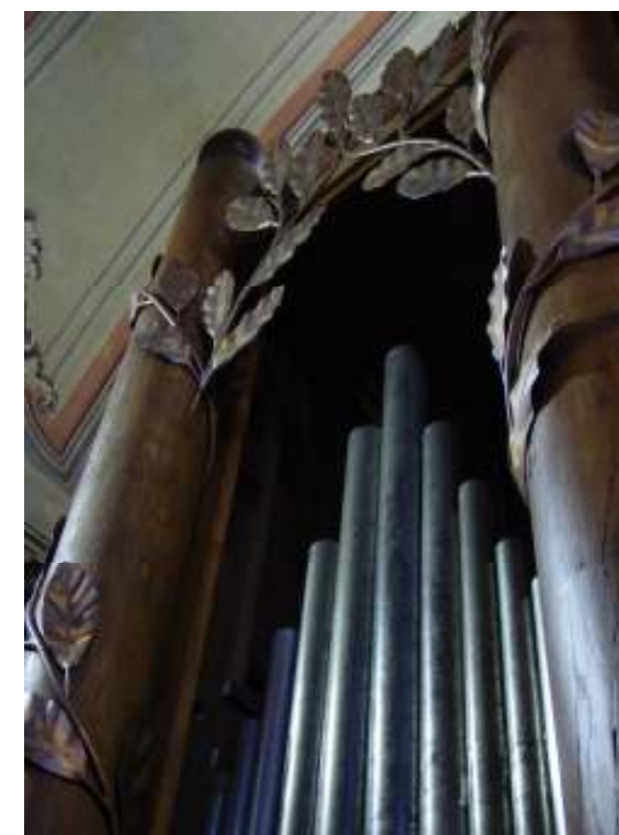
Particolare delle colonne e della decorazione