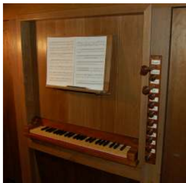
La console dello strumento antico