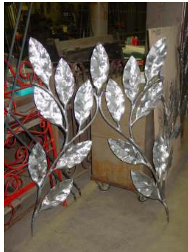
Decorazione in fase realizzativa