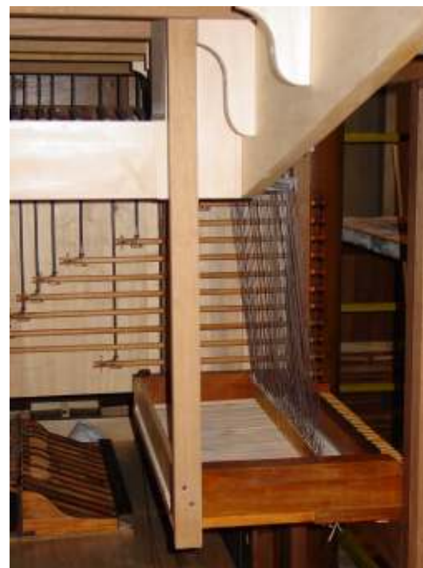
Particolare della meccanica