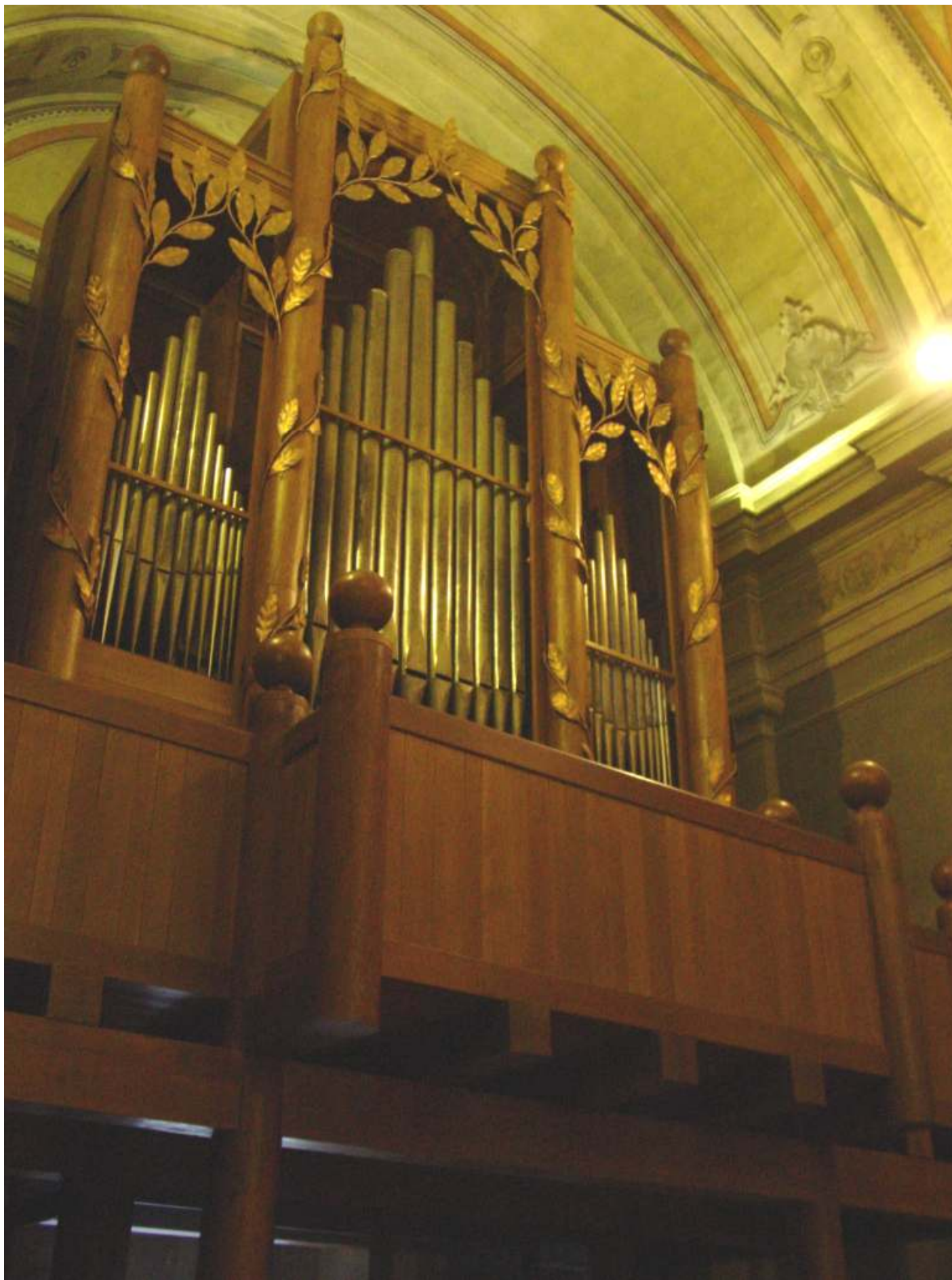
Veduta dal primo arone laterale destro della navata