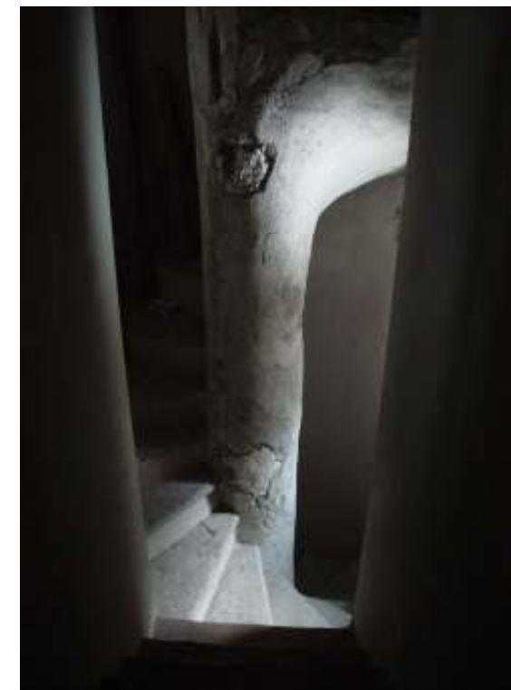
Scala di accesso alla tribuna