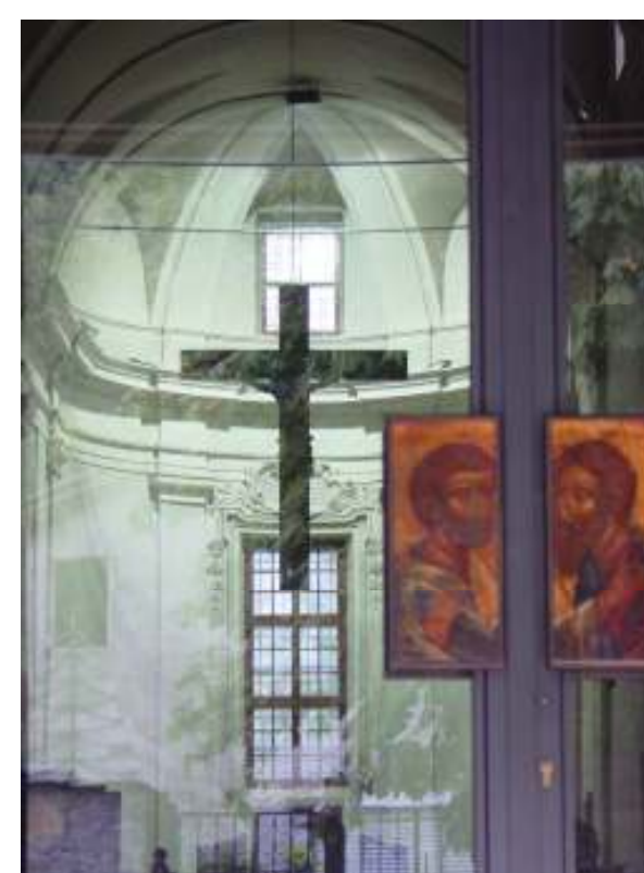
Tra esterno e interno