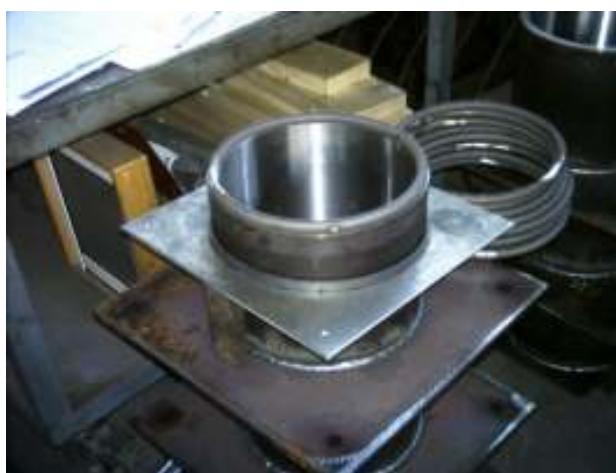
Bicchieri di basamento delle colonne