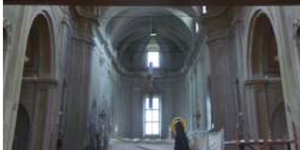
Veduta della navata