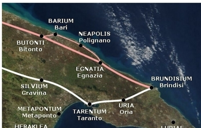
I tracciati (in bianco la via Appia Antica; in rosso la via Traiana)

Secondo Theodor Mommsen [5], il Natale che i coloni commemoravano era quello che corrispondeva alla data della loro purificazione, ossia del loro lustrum . In [1] viene invece proposto il giorno della cerimonia con l'aratro che definiva il perimetro della città, che era già stato predisposto con i lineamenta. Altrove, [6], si trova definita la cerimonia che ripeteva la fondazione di Roma da parte di Romolo come l'inaugurazione della città. In [6], all'inaugurazione (in [6] il caso discusso è quello di Pavia), Gianfranco Tibiletti crede si svolgesse la cerimonia dell'aratro il giorno che il sole si allineava col decumano (si veda Appendice).