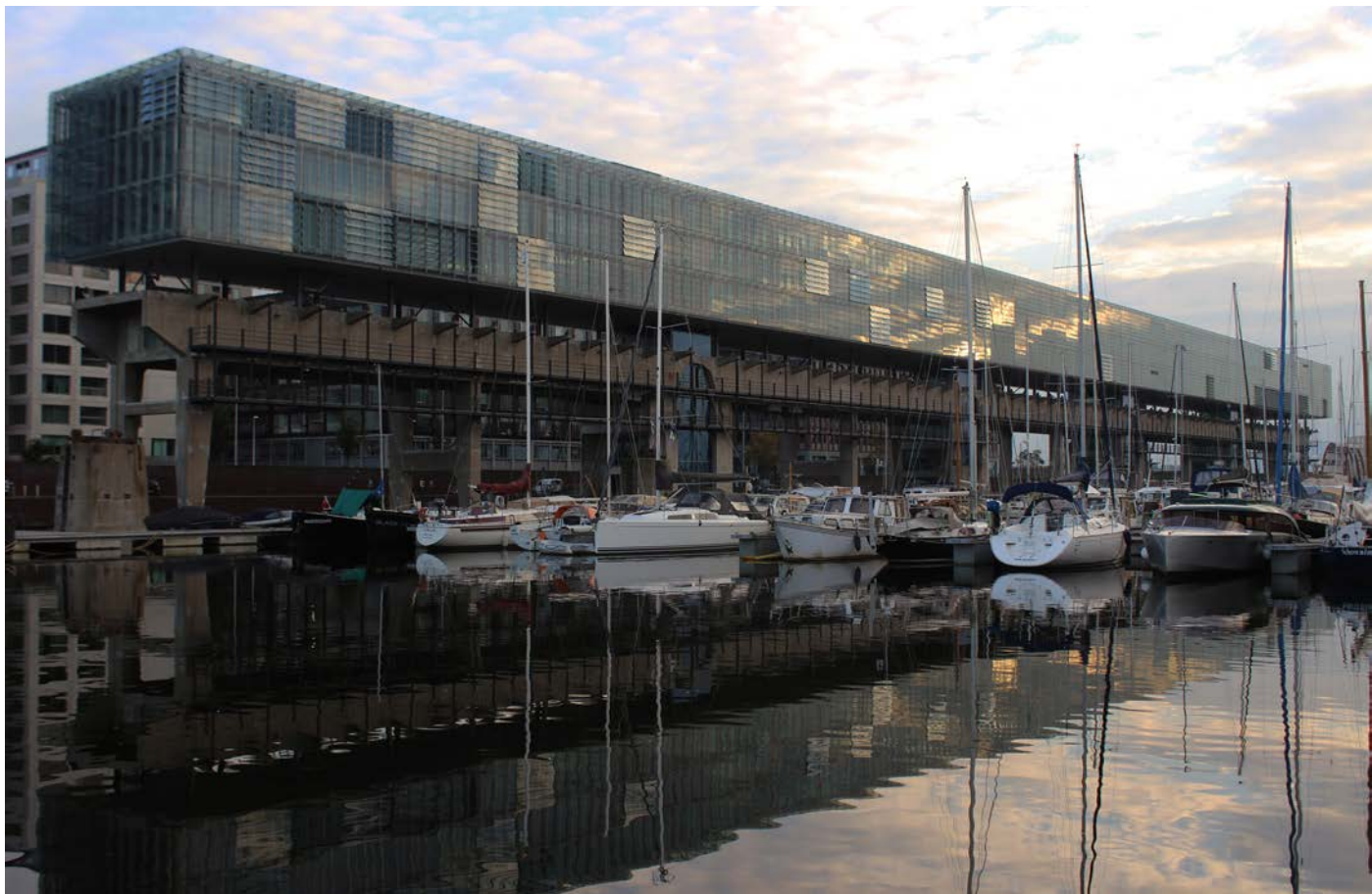
4. Fotografia attuale dell'edificio, 2020

(le fotografie e i disegni sono di Elena Guidetti)