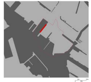
2. Inquadramento dell'edificio nell'area nord di Amsterdam

alla piattaforma su sottili pilastri in acciaio, con aggetti diversi ai due lati. I solai a sbalzo rispetto alla struttura portante raggiungono i 3,25 metri dall'asse dei pilastri dalla parte verso il porto, il doppio rispetto al lato opposto. Questo disallineamento nasce dal dimensionamento della struttura in calcestruzzo, calcolata per sostenere il peso asimmetrico delle gru, ma nel contempo ottiene l'effetto di far galleggiare il nuovo volume 3 metri al di sopra della preesistente struttura. Il nuovo volume vetrato si struttura su una successione di portali formati da profili in acciaio per i 33 pilastri e le travature corrispondenti, con controventi tubolari, tutti in acciaio, e si articola su tre livelli strutturalmente identici, dove i servizi sono annessi ai quattro corpi scala, lasciando una superficie libera di più di 2700 metri quadri per ogni piano di uffici (Fig.3). I collegamenti verticali, le scale a pozzo e gli ascensori panoramici, si posizionano all'interno dei piloni della struttura esistente. Nello scheletro in cemento armato, al secondo livello, si distribuiscono gli spazi di servizio e gli archivi, intervallati dalle sale riunioni. Questa organizzazione configura una pianta libera per i tre piani superiori, riservati agli uffici. Il nuovo Kraanspoor si articola come uno spazio di lavoro contemporaneo, un grande incubatore, di indubbia semplicità formale