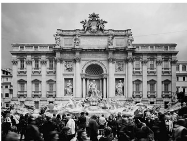
L'incisione di Giovan Battista Piranesi della Fontana di Trevi a confronto con la fotografia di Gabriele Basilico.

fotografate della capitale, un tempo meta del Grand Tour e oggi del turismo di massa. O ancora la fotografia delle chiese di Santa Maria di Loreto e del Santissimo Nome di Maria al Foro Traiano, dove campeggiano i manifesti della costruzione della Metro C. Tanti piccoli frammenti di contemporaneità arricchiscono le fotografie di Basilico, raccontandoci di una città in cui la monumentalità si mescola con il quotidiano di una metropoli complessa. Quello tra Piranesi e Basilico diventa dunque un confronto tra modi di rappresentare lo spazio urbano e il proprio tempo, per celebrarlo o metterne in luce le contraddizioni.