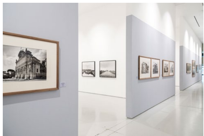
Museo Ettore Fico, Gabriele Basilico/Giovan Battista Piranesi. Viaggi e vedute: da Roma a Shanghai.