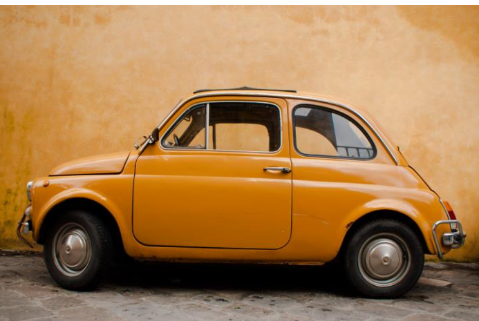
Fig. 4: La Fiat 500 de Dante Giacosa, 1957 (licencia CC-BY 2.0, foto de Rutger Tuller)

Más allá de los medios de transporte individuales y familiares, es crucial también la imagen relativa a las grandes infraestructuras nacionales, dispositivos que conectan el país tanto material como simbólicamente: el rediseño de las áreas de servicio por arquitectos de renombre como Mazzoni y Ridolfi; el perfil streamline del tren Etr 300 (más conocido como Settebello ) diseñado por Giulio Minoletti, que a partir de 1950 conecta por primera vez norte, centro y sur de Italia con un único viaje; los Autogrill , célebres restaurantes con forma de puente de carretera —inicialmente financiados por una gran empresa del sector alimentario como Pavesi— que surgen a lo largo de toda la red nacional de autopistas entre 1959 y 1971.