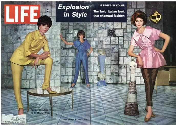
Fig.8. Portada de Vogue, 1 diciembre 1961.

fascinantes interiores de los diseñadores italianos, y las instalaciones que funden arquitectura y artes visuales para Italia '61 , la célebre Exposición Internacional del Trabajo organizada en Turín para celebrar los cien años de la unidad nacional.