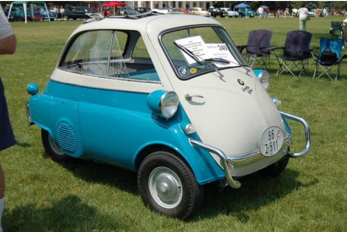
Fig. 3: La Isetta de Ermenegildo Preti, 1953 (licencia CC-BY 2.0, foto de Corvair Owner).