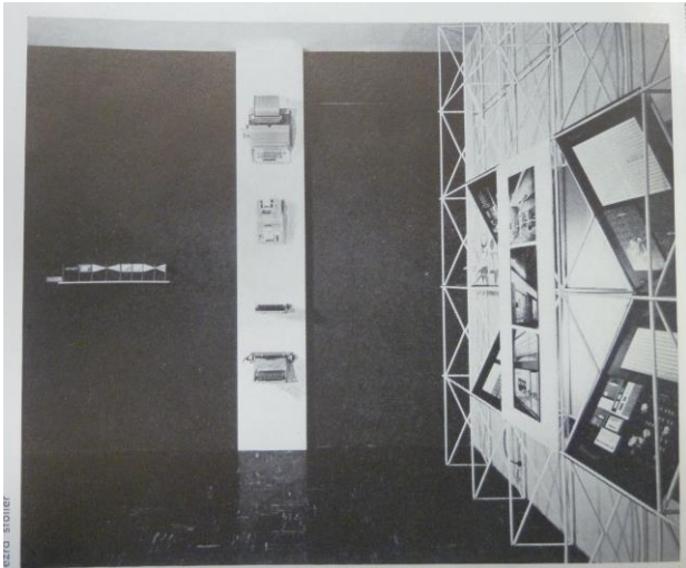
Fig. 6. La exposición Olivetti: Design in Industry , MoMA (NY), 1952.

La primera gran exposición enteramente dedicada al diseño de lo cotidiano in Italia es Italy at Work, Her Renaissance in Design Today , que tiene lugar por primera vez en el Brooklyn Museum de Nueva York para luego seguir de gira, del 1950 al 1953, a otras 12 ciudades norteamericanas: un evento de gran éxito de público, relacionado sobre todo con las cuestiones del comercio y de la pequeña y mediana empresa de carácter artesanal o semiartesanal. La iniciativa proyecta una imagen tranquilizadora de la producción italiana: antes que nada se resalta la ausencia de competición entre ésta y la industria americana, y se hace continuamente hincapié en la extraordinaria capacidad de los artistas/artesanos italianos para resurgir de las cenizas como un ave fénix, ilustrando “la unidad de las Artes del Diseño”, algo que “los italianos nunca han perdido de vista”. 15 Respecto a ello es significativo, también lo que escribe en el breve prefacio para el catálogo Walter Dorwin Teague, según quien los artefactos expuestos no tienen que ser vistos como los “frutos de un movimiento maduro y bien consolidado”, sino más bien como “el vigoroso florecimiento de una nueva primavera, un rebrote de vitalidad italiana que parece haberse guardado durante el largo y gris interludio fascista, esperando este nuevo día de sol”. 16