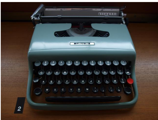
Fig. 1 : La Lettera 22 Olivetti de Marcello Nizzoli, 1950 (licencia CC-BY 2.0, foto de Tomislav Medak).

Los datos, en este sentido, son reveladores: entre 1957 y 1964 la fabricación de automóviles aumenta de 148.000 a 760.000 unidades, las neveras pasan de 370.000 a un millón y medio, las lavadoras de 70.000 a 260.000 y los televisores —que en 1954 eran menos de 90.000— llegan a más de 630.000. 3 Cifras que se hacen aún más significativas si se amplía el periodo de análisis, llegando hasta principios de la década siguiente: los poseedores de un coche privado son 340.000 en 1954, y 4.670.000 en 1970, mientras los ciclomotores pasan de 700.000 a 4.300.000 unidades; las familias que poseen una nevera pasan del 13% al 55%, y las que poseen una lavadora del 3% al 25% 4 . Gracias también al fuertísimo incremento en la producción de materiales plásticos, en el mismo periodo se cuadruplica la fabricación de máquinas de escribir y se producen diez veces más calculadoras: eso evidentemente va de la mano con el gran éxito nacional e internacional de Olivetti, caso ejemplar de empresa “ilustrada” en la que, como es bien sabido, la aportación de los diseñadores en todos los ámbitos, —de la arquitectura al diseño de producto y la gráfica— juega un papel fundamental.