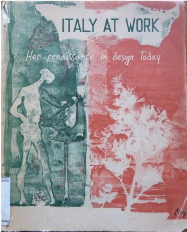
Fig. 7: Catálogo de la exposición itinerante Italy at Work: Her Renaissance in Design Today, 1950-1953 .

La celebración del diseño italiano en EE.UU. continúa durante toda la década, oscilando entre la visión especializada de las revistas de arquitectura —que proponen largas y detalladas contribuciones dedicadas a los diseñadores italianos— y los éxitos comerciales de los artefactos más icónicos del diseño italiano incluidos en la oferta de los department stores .