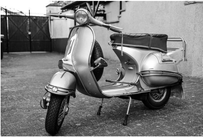
Fig. 2: La Vespa de Corradino d'Ascanio, 1946 (licencia CC-BY 2.0, foto de Wakataitea-Filmrollen).

Un sector decisivo para la construcción del mito del Made in Italy es indudablemente el de los medios de transporte. El éxito de los años inmediatamente posteriores al fin de la segunda guerra mundial es el de los scooters versátiles y de bajo consumo como la Vespa de Corradino d'Ascanio (1946) y la Lambretta de Cesare Pallavicino (1947). Tanto d'Ascanio como Pallavicino son ingenieros aeronáuticos que viven la reconversión radical de las grandes industrias de vehículos tras la guerra: ya no hacen falta helicópteros y otras máquinas bélicas, sino scooters y vehículos para el tiempo libre. La Vespa y la Lambretta encarnan, por lo tanto, la promesa de nuevos tiempos, más alegres y despreocupados, que se abren ante los ojos de los ciudadanos italianos: también por esta razón entran muy rápidamente —sobre todo la primera— en el imaginario colectivo y entre los iconos de identidad nacional más célebres y duraderos 5 .