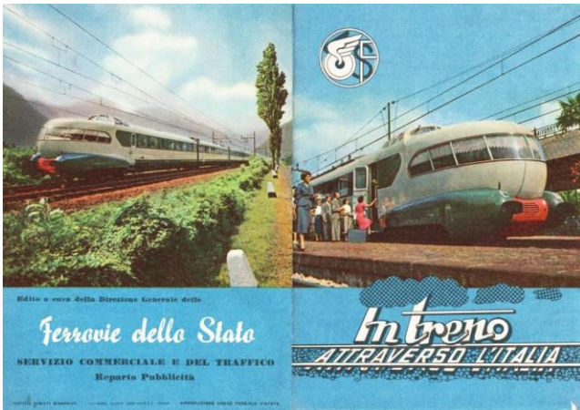
Fig.5. El tren ETR 300 (Settebello) de Giulio Minoletti, 1949 (licencia CC-PDM, imagen de dominio público).

Por lo que concierne al ámbito doméstico, aumentan de manera significativa los gastos familiares relativos a mobiliario y electrodomésticos, mientras que en el campo de la moda la costura artesanal deja progresivamente lugar a las grandes marcas 6 y al pret-à-porter . Los muebles y los accesorios de las grandes firmas del diseño italiano —Ponti, Castiglioni, Mollino, Munari— ganan notoriedad también a través de La Rinascente, cadena de venta de productos de gama medio-alta que en 1954 instituye el célebre “Compasso d’oro”, reconocimiento dirigido a aquellas creaciones del diseño italiano excelentes tanto por razones de estética como de funcionalidad. 7