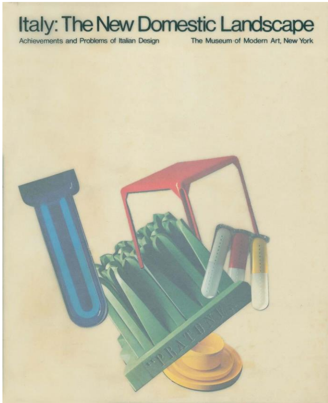
Fig. 9. Catálogo de la exposición Italy: The New Domestic Landscape , MoMA (NY), 1972.

Este sentimiento difuso de admiración, además, no pierde intensidad con el paso del tiempo sino que se consolida ulteriormente. A mediados de los años Noventa, en las páginas del New York Times Michael Kimmelman escribe: “Durante los años de prosperidad sucesivos a la guerra Italia personificó el glamour . A partir de finales de los años '50, el país vivió lo que los propios italianos consideran un milagro de expansión económica e industrial, después del declive de los años fascistas. Pero el milagro más grande fue la cantidad de personas de talento que llegaron a la madurez tras el segundo conflicto mundial, y que dieron a la Italia que resurgía una cultura y un estilo que llegaron a su cumbre a mediados de los años '60”. 25