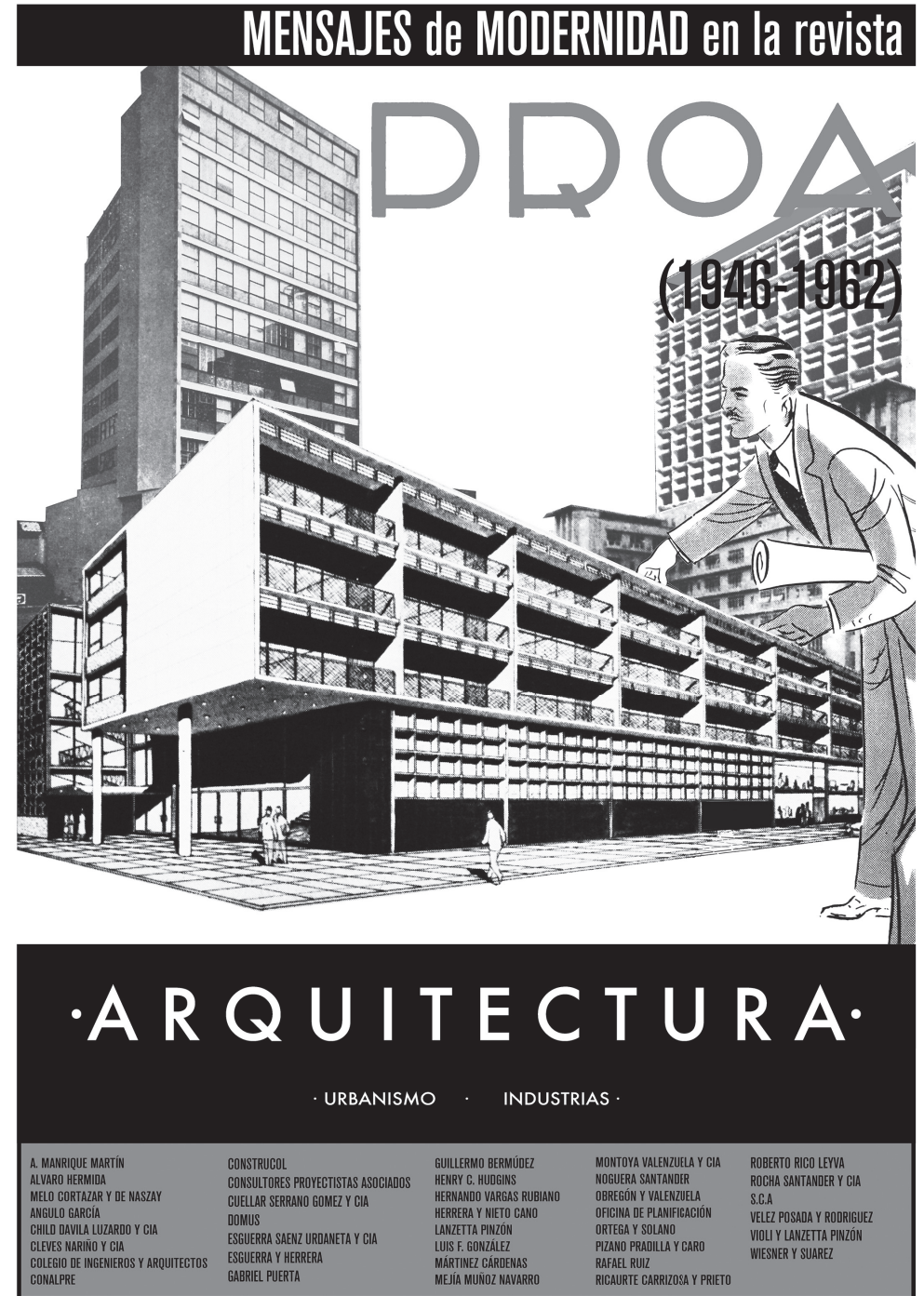
Fig 2. Imagen resumen de publicidades de arquitectos en revista Proa, Colombia, 1946-1962.