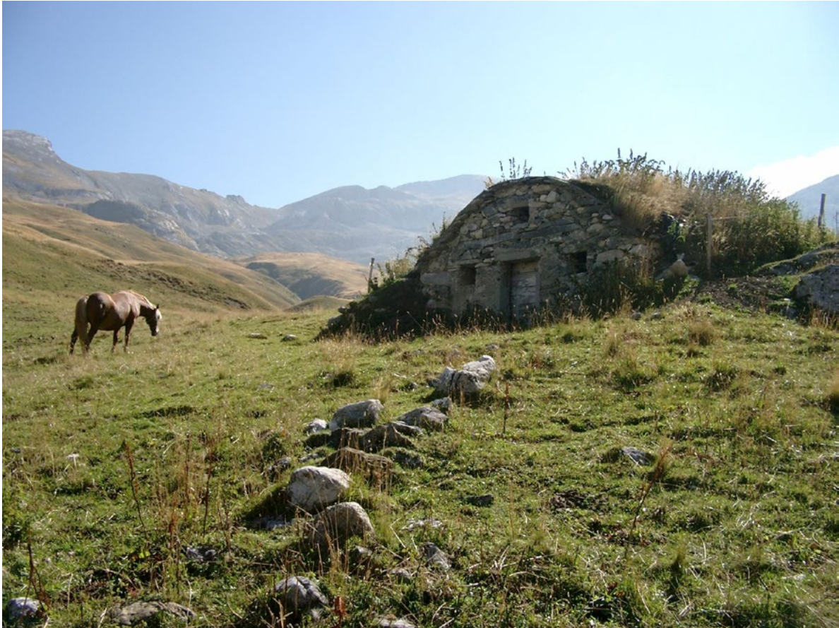
Figura 8. Alpeggio nell'area G.A.L. Mongioie, con locale per la conservazione dei latticini, detto "sella" o "truna".