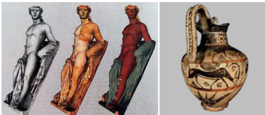
Fig. 9 – 3D-COFORM, 2008-2012. A sinistra: una porzione del fregio del Tempio di Luni; a destra: modello digitale tridimensionale di una oinochoe a becco trilobato da Camiros, Rodi, 625-600 a.C.