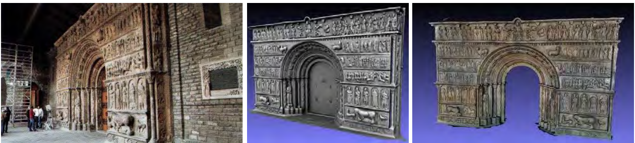
Fig. 3 – Portale di Ripoll, 2008 ( http://www.omnia.ie/index.php )

Il progetto del “Portale di Ripoll”, condotto dal CNR, ha avuto invece come obiettivo la creazione di un modello digitale tridimensionale del singolo monumento e la realizzazione di un sistema per la presentazione virtuale interattiva al pubblico museale. Il portale del monastero di Ripoll è un monumento fondamentale per il romanico catalano, con un’enorme superficie scolpita e un racconto iconografico estremamente ricco di contenuti e simbologia. Il monumento è stato rilevato attraverso scansioni laser 3D ad alta risoluzione. Il dataset prodotto è costituito da più di 2000 singole riprese, per un totale di circa 500 milioni di punti campionati. Il modello 3D risultante, che codifica forma e colore ad una risoluzione di circa un campione per millimetro, per un totale di 170 milioni di triangoli, è stato poi utilizzato per creare l’installazione interattiva all’interno del museo (Cessari, D’Agata, 2009). Il sistema di presentazione virtuale interattiva consiste in un grande schermo in retroproiezione e permette ai visitatori di navigare sul portale, di analizzarne il dettaglio scultoreo da qualsiasi altezza e direzione e infine di accedere interattivamente alle numerose fonti di informazione collegate spazialmente ai corrispondenti punti della superficie. Il livello di dettaglio raggiunto dal modello 3D è altissimo, con un conseguente livello di fruizione fortemente iperrealistico (fig. 3).