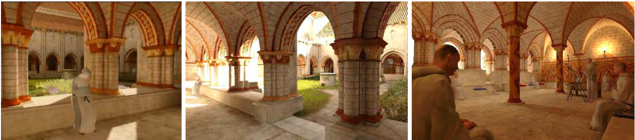
Fig. 4 - Abbaye Royale de Nieul sur l'Autise , 2008

visualizzazione, senza semplificazione, di grandi volumi di dati. L'atmosfera dell'ambiente virtuale, gli effetti di chiaroscuro, le luci calde degli interni, producono nel visitatore una vera e propria sensazione di partecipazione spirituale ed emozionale alla vita e alle relazioni all'interno dell'Abbazia (fig. 4).