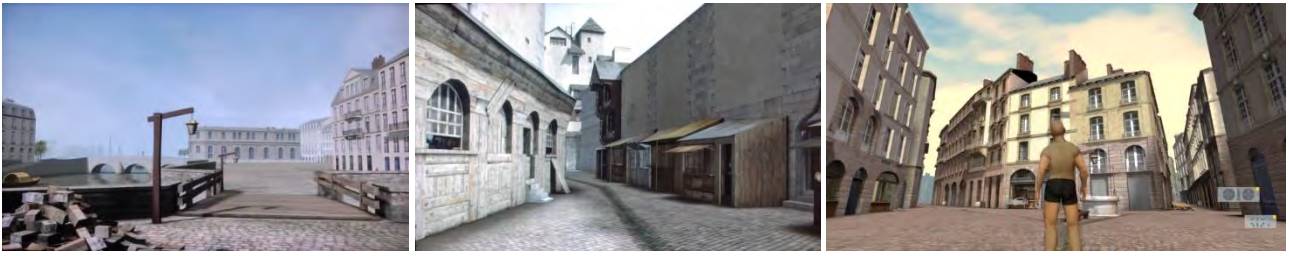
Fig. 2 – Nantes en 1757, 2008/2009 ( http://flickr.com e http://spatialmedia.ensadlab.fr/nantes-1757-en-ligne/ )

Il progetto del “Portale di Ripoll”, condotto dal CNR, ha avuto invece come obiettivo la creazione di un modello digitale tridimensionale del singolo monumento e la realizzazione di un sistema per la presentazione virtuale interattiva al pubblico museale. Il portale del monastero di Ripoll è un monumento fondamentale per il romanico catalano, con un’enorme superficie scolpita e un racconto iconografico estremamente ricco di contenuti e simbologia. Il monumento è stato rilevato attraverso scansioni laser 3D ad alta risoluzione. Il dataset prodotto è costituito da più di 2000 singole riprese, per un totale di circa 500 milioni di punti campionati. Il modello 3D risultante, che codifica forma e colore ad una risoluzione di circa un campione per millimetro, per un totale di 170 milioni di triangoli, è stato poi utilizzato per creare l’installazione interattiva all’interno del museo (Cessari, D’Agata, 2009). Il sistema di presentazione virtuale interattiva consiste in un grande schermo in retroproiezione e permette ai visitatori di navigare sul portale, di analizzarne il dettaglio scultoreo da qualsiasi altezza e direzione e infine di accedere interattivamente alle numerose fonti di informazione collegate spazialmente ai corrispondenti punti della superficie. Il livello di dettaglio raggiunto dal modello 3D è altissimo, con un conseguente livello di fruizione fortemente iperrealistico (fig. 3).