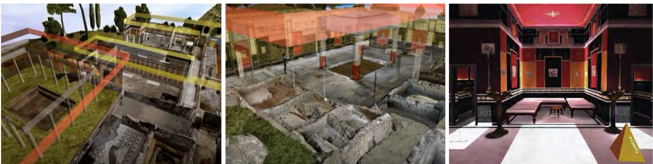
Fig. 7 - Museo virtuale della via Flaminia Antica a Roma, 2006-2008 ( https://www.youtube.com/watch?v=krmH8H9I-tc )

Il Museo virtuale della via Flaminia Antica è uno dei migliori esempi del settore del Virtual Heritage in Italia. Il principale obiettivo raggiunto è sicuramente la ricostruzione virtuale di una zona archeologica che possiede un valore culturale immenso ma che, nonostante ciò, è poco conosciuta. Si tratta di un sito difficilmente accessibile. La ricostruzione virtuale ha avuto come obiettivo quello di comunicare i dati archeologici ottenuti durante le numerose campagne di scavo che hanno interessato tutta l’area. Il secondo obiettivo del progetto coincide con il tentativo di interpretazione dei dati mediante la ricostruzione 3D, con particolare attenzione al dualismo vero-verosimile.