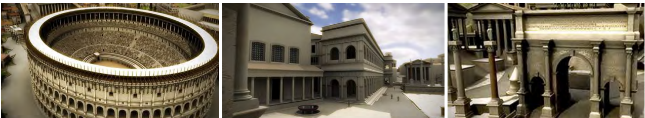
Fig. 1 – Rome Reborn , 1996-2018: Anfiteatro Flavio, Foro Romano e Arco di Settimio Severo ( http://romereborn.frischerconsulting.com/gallery-current.php )