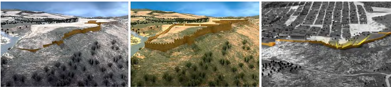
Fig. 6 – Le mura di Akragas, 2007

Il Museo virtuale della via Flaminia Antica è uno dei migliori esempi del settore del Virtual Heritage in Italia. Il principale obiettivo raggiunto è sicuramente la ricostruzione virtuale di una zona archeologica che possiede un valore culturale immenso ma che, nonostante ciò, è poco conosciuta. Si tratta di un sito difficilmente accessibile. La ricostruzione virtuale ha avuto come obiettivo quello di comunicare i dati archeologici ottenuti durante le numerose campagne di scavo che hanno interessato tutta l’area. Il secondo obiettivo del progetto coincide con il tentativo di interpretazione dei dati mediante la ricostruzione 3D, con particolare attenzione al dualismo vero-verosimile.