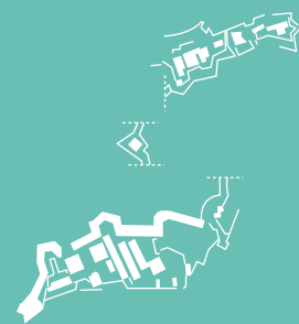
Forte di Fenestrelle