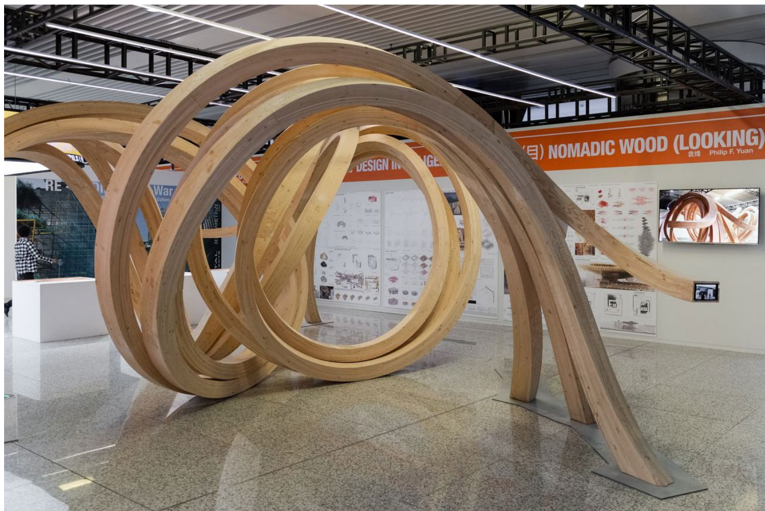
The Eyes of the city, Biennale di Shenzhen 2019-20.